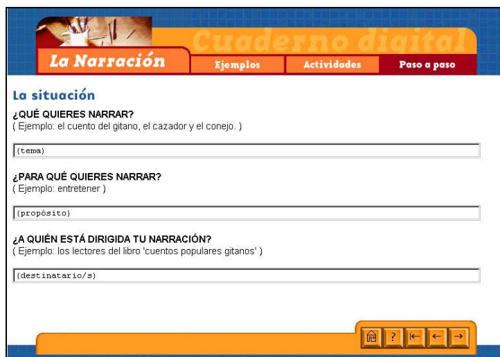
Cuaderno digital en línea: el análisis de la situación comunicativa

Para orientarles en esta tarea, el programa les muestra un ejemplo, en el que recupera el texto propuesto como modelo en la Introducción a fin de analizar su situación comunicativa.