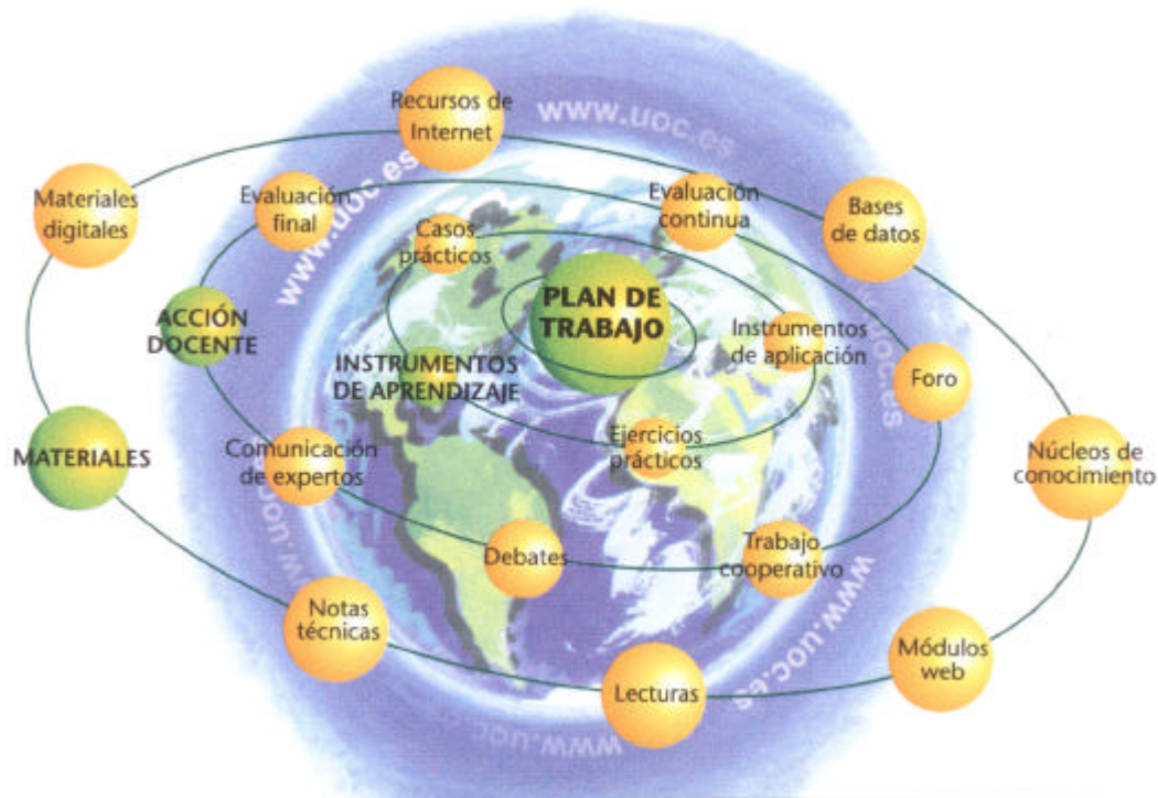
Figura 2. Diseño de Materiales Didácticos Multimedia para entornos virtuales de Aprendizaje. Edulab (UOC) (2001) p. 3

progreso técnico y dominio de nuevas tecnologías, no hay avance tecnológico sin desarrollo científico y, a su vez, este hunde sus raíces en un sistema educativo de alta calidad, la cual se refiere principalmente a la universidad. Las sociedades que no cuentan con un sistema educativo, universitario, científico y tecnológico de gran calidad, y que no forman parte activa de algunos de los bloques económicos mundiales, enfrentan la posibilidad de que la Globalización les produzca efectos sumamente negativos, que aumenten la brecha que separa las sociedades desarrolladas de otras de muy bajo desarrollo. Frente a tales condiciones, un instrumento fundamental para modificarlas, sería una universidad configurada como una institución globalizadora y virtualizada .