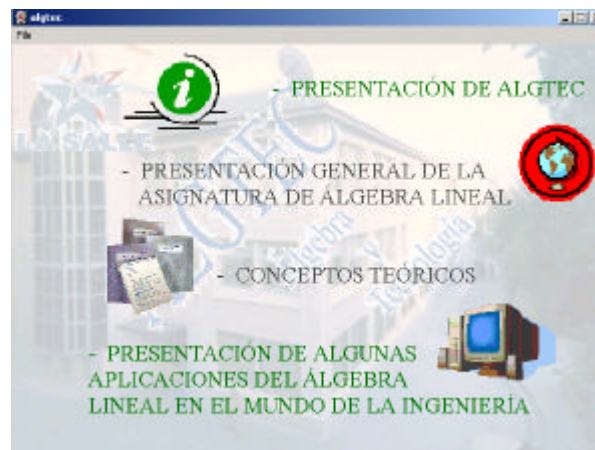
Figura 1. Pantalla inicial de la aplicación ALGTEC

Al poner en marcha la aplicación aparece la pantalla que se muestra en la figura 1 , con las 4 opciones iniciales disponibles: una 'autopresentación' de la aplicación, una visión global de la asignatura de álgebra impartida en nuestra universidad, la posibilidad de consultar conceptos teóricos, y la última de las opciones disponibles, que presenta un nuevo menú que permite al usuario seleccionar una de entre varias situaciones técnicas presentadas. Acto seguido, da la opción de visualizar una explicación detallada de cómo el álgebra puede ayudarnos en la situación elegida, o bien de experimentar con los conceptos algebraicos implicados, realizando simulaciones que permitan hacer pruebas y validar razonamientos.