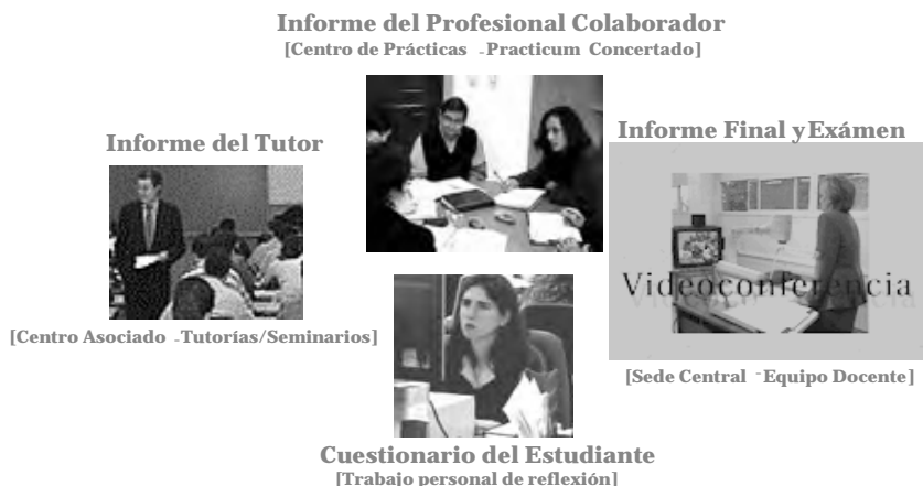
Figura 1. Elementos de la evaluación

Cada uno de estos elementos son necesarios para proceder a la evaluación del Practicum. Se presenta una tabla resumen de estos elementos indicando dónde se hace el envío en función de que se presenten en junio o septiembre. (Tabla 1)