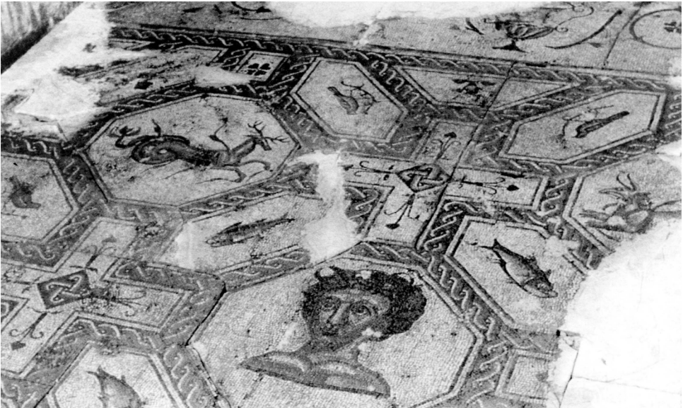
Fig. 10- Mosaico con Tritón y animales fantásticos Sasamón (Burgos). Finales del siglo II-comienzos del III.

En este grupo hemos agrupado aquellos animales que como los hipocampos 51 presentan la mitad posterior de su cuerpo en forma de animal marino ( kethoi , toros, ciervos, cabras, felinos...). Existen veintiún mosaicos. Pueden estar en solitario (Sasamón, con el tritón ya citado en el centro (Fig. 10); Pompaelo ? 52 ; Ciella,