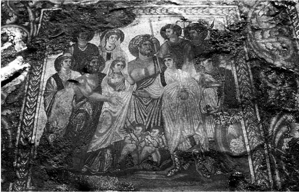
Fig. 4- Mosaico de las Bodas de Cadmo y Harmonia de la Villa de La Malena, Azuara (Zaragoza). Siglo IV- V.