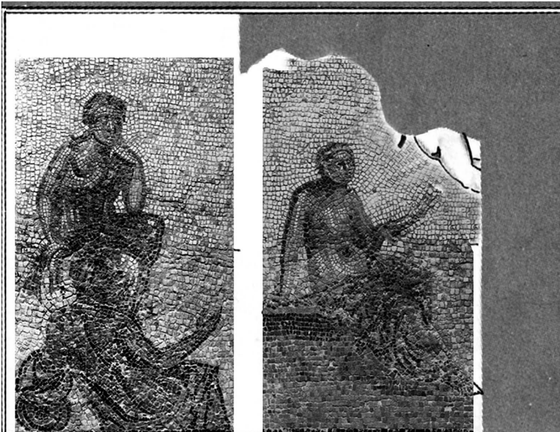
Fig. 16- Mosaico con la ninfa Metope en el Mosaico de Fernán Nuñez (Córdoba). Finales del siglo III.

Se identifica a la ninfa Metope, madre de Egina, en el pavimento perdido de Fernán Nuñez (Córdoba), ya citado, dentro del episodio mitológico del rapto de su hija (Fig. 16). Esta representación constituye un unicum en la musivaria romana.