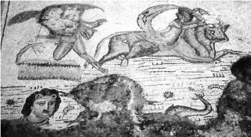
Fig. 11- Mosaico de los Amores de Zeus de la Colonia Augusta Firma Astigi. Siglo II-III.

Un unicum en la musivaria romana lo constituye la cabeza que emerge del agua, con abundante cabellera, orejas leoninas y quizás una serpiente al cuello en