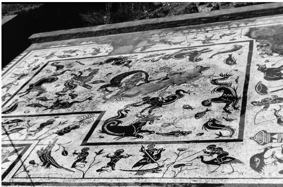
Fig. 1- Mosaico del «Triunfo de Neptuno» de Itálica. Segunda mitad del siglo II.

De esta divinidad existen siete representaciones, con cuatro iconografías diferentes. En la primera aparece el dios guiando su carro tirado por dos hipocampos inmerso en una travesía marina, denominada «Triunfo de Neptuno». Esta escena se documenta en cuatro mosaicos del Alto Imperio, en Itálica (Sevilla) fechado en la segunda mitad del siglo II 5 (Fig. 1), en Augusta Emerita de la primera mitad del siglo III 6 , en Puig de Cebolla, Valencia de finales del siglo III 7 y en el de Tarraco , del siglo II, estos dos últimos hoy desaparecidos. En los mosaicos de Itálica y Augusta Emerita el dios avanza hacia la derecha y está rodeado de un cortejo marino formado por peces variados, delfines, tritones, hipocampos..., que acentúan el apoteosis de la imagen. Mientras que el mosaico de Valencia en la travesía del dios se muestra únicamente el agua como marco del escenario marino. Las representaciones del «Triunfo de Neptuno» gozaron de gran auge en Italia en la mu-