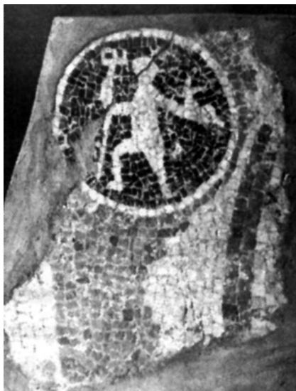
Fig. 3- Mosaico de Neptuno de procedencia desconocida, de la Colección Martí Estevez SIAM de Valencia.

La tercera iconografía de Neptuno aparece, sin procedencia, en la Colección Martí Estevez, en el Servicio de Investigación Arqueológica Municipal de Valencia (SIAM). Está representado de pie, en actitud de andar, con la cabeza girada hacia atrás, llevando un tridente en su mano derecha, como el bronce cántabro anteriormente citado, y un delfín en la mano izquierda (Fig. 3) 12 .