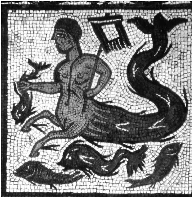
Fig. 8- Mosaico de Tritón de Conimbriga (Portugal). Finales del siglo II- principios del III.