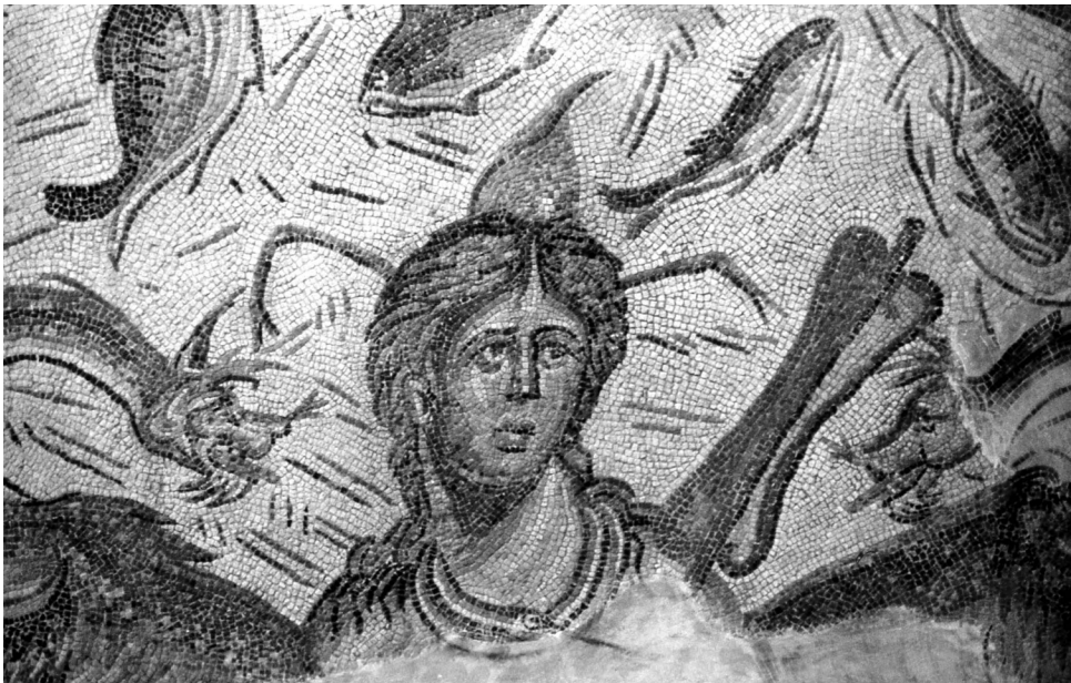
Fig. 6- Mosaico de Tethys de Marroquies Alto (Jaén). Segunda mitad del siglo IV.

y una concha rodean a la diosa. La iconografía de Tethys sola y en busto aparece en varios mosaicos de los siglos III y IV, hallados principalmente en la parte oriental del Imperio, en Antioquia y Siria (Shahba Philippopolis) 20 . Los atributos de los kethoi , el remo y el contexto marino de peces son los habituales. El atributo de las patas de cangrejo que lleva en la cabeza, no aparece en ningún ejemplar de la serie, pues son más propias de Océano y de Thalassa. Esta última personificación femenina del mar también aparece en la musivaria oriental con la misma iconografía que Thetys, en busto, sola o con Océano, remo, monstruos marinos, delfines y otros peces como en los pavimentos de Jordania y Armenia, así como los de Libia, fechados entre los siglos II al VI, aunque suele llevar su nombre en griego para su identificación 21 . Por lo tanto existe una interrelación iconográfica entre ambos personajes, aquí estaría representada Thetys o Thalassa (?).