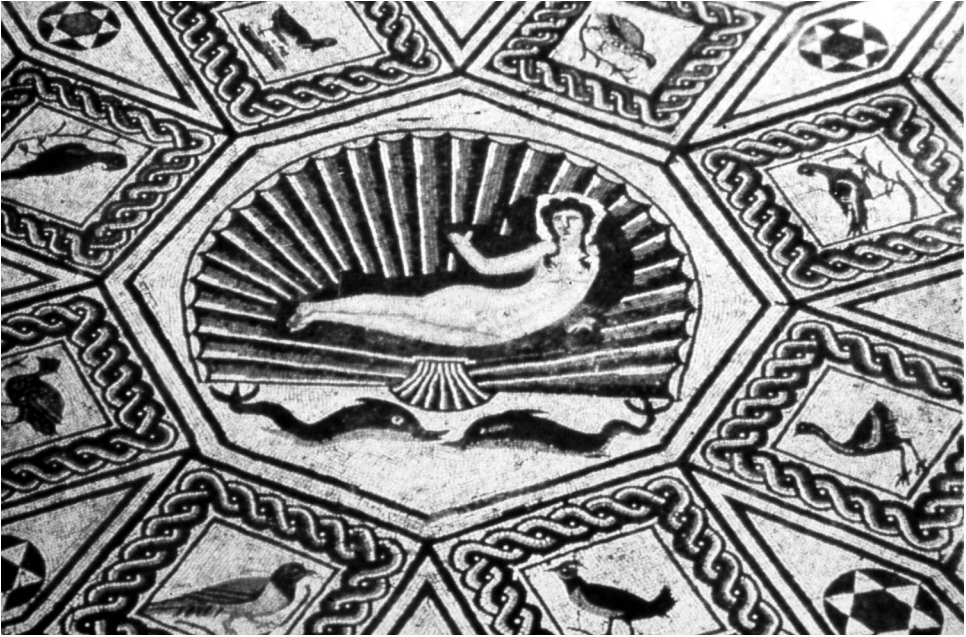
Fig. 5- Mosaico del Nacimiento de Venus de Cártama (Málaga). Finales del siglo II

nilla dos tritones sostienen la concha, iconografía que aparece igualmente en la musivaria bícroma de Italia, siglo II, y en la producción norteafricana y oriental con el Triunfo y la «Toilette» de Venus 17 .