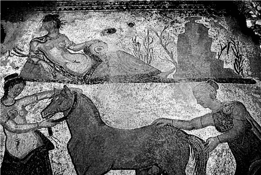
Fig. 14- Mosaico de la «Toilette de Pegaso» de la Villa de Almenara de Adaja (Valladolid). Siglo IV

En la musivaria hispana están representadas Hipocrene y Amymone. La primera brotó, según la leyenda, al golpear Pegaso con una de sus pezuñas la tierra, por lo que se conoce también con el nombre de la «Fuente del Caballo» y estaba consagrada a las Musas 81 . Aparece en la villa de Almenara de Adaja (Valladolid) en el contexto del mosaico de la «Toilette de Pegaso» del siglo IV 82 , como una figura femenina recostada sobre una roca al pie del monte Helicón (Fig. 14). La ninfa Amymone, que fue transformada en fuente por Neptuno y como tal es citada por los autores antiguos (Apoll. II, 14; Hyg. Fab. 169), figura en el pavimento de Las Metamorfosis de la villa de Carranque (Fig. 15). Ambos mosaicos se fechan en el siglo IV.