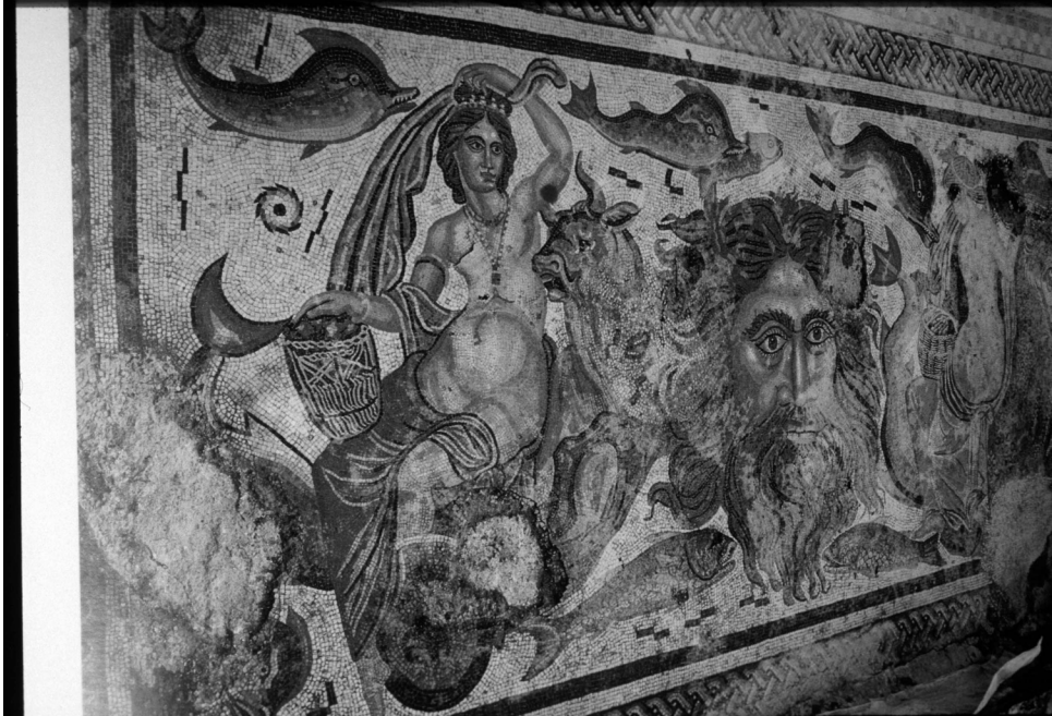
Fig. 9- Mosaico de Océano de la Villa de Dueñas (Palencia). Siglo IV.

vadas de una domus descubierta recientemente en Écija 42 , o de otro personaje actualmente indeterminado por su destrucción (Santa Vitória). También aparece con Eros navegando sobre un ánfora (Carmona) 43 , con Eros y Psique (pav. perdido de Itálica), 44 con Polifemo (mosaico de Polifemo y Galatea de Córdoba) 45 , aislada (Dehesa del Hinojal, está representada recostada sobre un kethos ) 46 . A veces están identificadas por una inscripción con su nombre como ocurre con Galatea en el pavimento de Galatea en Algorós, Elche (la figura se encuentra sentada sobre un hipocampo, con la particularidad que está nimbada resaltando su carácter divino) 47 ; inscripciones con su nombre aparecen igualmente en los mosaicos de Antioquía