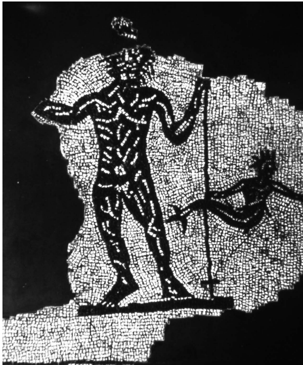
Fig. 2- Mosaico de Neptuno de la Villa de la Salud en Sabadell (Barcelona). Finales del siglo II o principios del III.

La segunda iconografía de Neptuno de la musivaria hispana aparece en el mosaico de la Villa de la Salud en Sabadell, de finales del siglo II o principios del III 9 (Fig. 2). El tipo derivaría de un modelo escultórico griego de época helenística y aparece representado, además de en esculturas y relieves, en otros mosaicos, de los siglos II- IV, de Ostia, Comiso y Djemila (Túnez) 10 . En Hispania aparece en un bronce cántabro de Castro Urdiales 11 . La divinidad se representa en pie, de frente, con cetro en la mano izquierda y un tridente en la mano derecha. Junto a Neptuno