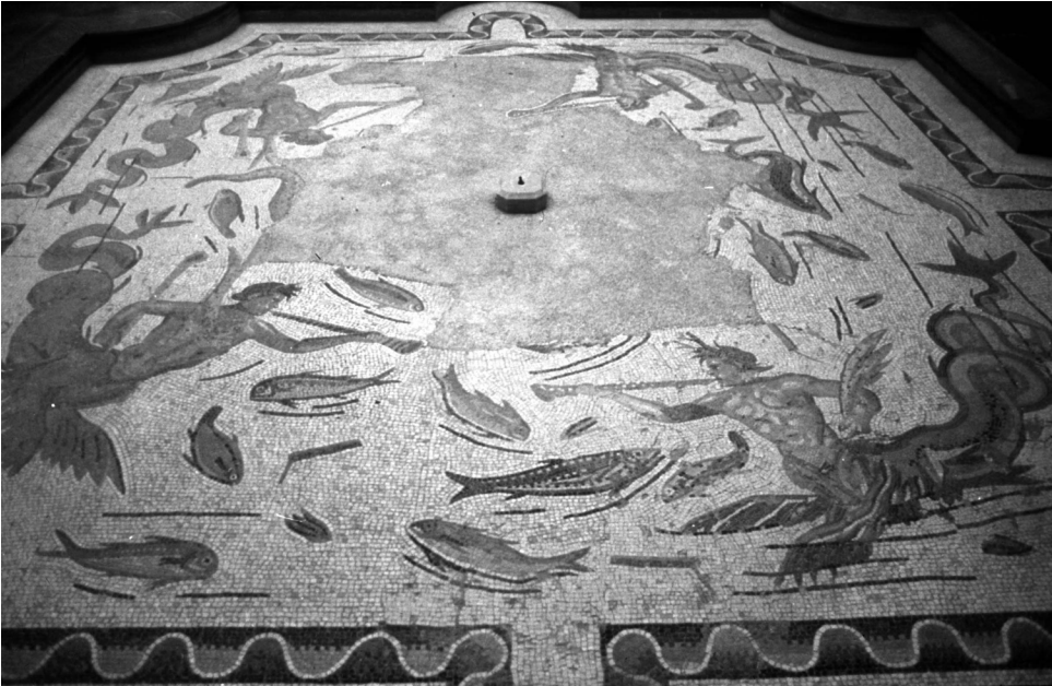
Fig. 7- Mosaico de Tritones de Itálica. Comienzos del siglo III.