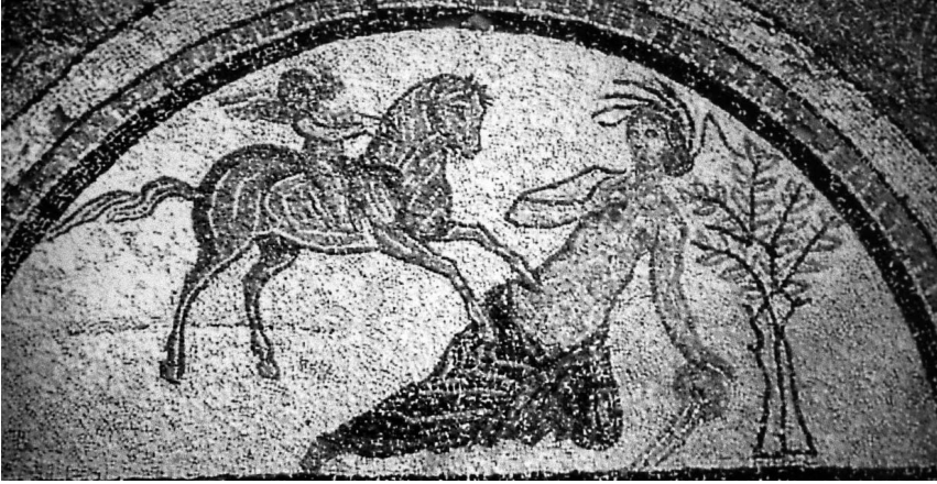
Fig. 15- - Mosaico de La Metamorfosis de la Villa de Carranque (Toledo): Ninfa Amymon. Siglo IV.