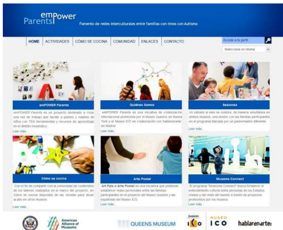
Fig. 8. Página de inicio en español de la plataforma digital www.empowerparents.net

aquellas personas interesadas en promover nuevas iniciativas en comunidad. Así, cada usuario interesado en participar en la red puede crear un perfil que le permitirá disponer de una zona de trabajo en la que compartir archivos y recursos con otros usuarios, difundir noticias de interés, participar en foros y ampliar así las posibilidades de llevar a cabo réplicas del proyecto en otros museos y espacios culturales.