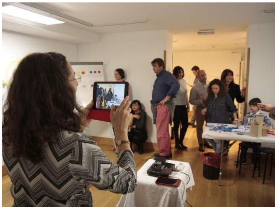
Fig. 6. Proceso de documentación gráfica por parte de una de las participantes durante una sesión en el Museo ICO.

Junto a la organización del espacio y la distribución de las tareas de las sesiones, el factor temporal está igualmente sujeto a unas rutinas que se repiten en cada taller desde el momento en que los niños se sientan en su mesa y cada adulto ha asumido su posición: una canción de bienvenida, la presentación del taller que vamos a realizar -normalmente apoyada en pictogramas o recursos audiovisuales-, el desarrollo de la actividad creativa, la visita a un espacio concreto del museo (fig. 7), la exposición y presentación de los trabajos realizados para compartir los resultados, un baile final y una merienda para los niños. Durante esta última fase, padres y educadores se reúnen en otro espacio de trabajo con el fin de evaluar los resultados en una breve reunión paralela.