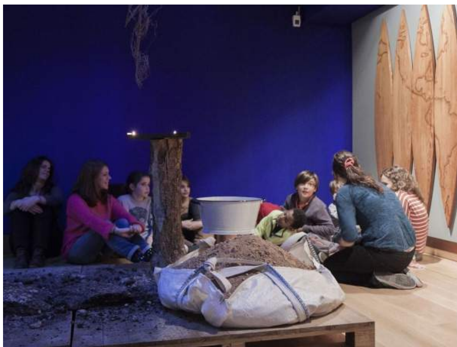
Fig. 7. Visita a la sala de exposición durante la sesión “Viajes y viajeros” en el Museo ICO.

llevarse a cabo sin facilitar otras vías para que los participantes se conocieran más a fondo. Entre ellas, destaca la de Art Pals o arte postal, donde las familias de ambos lados del Atlántico se han emparejado en función de intereses comunes, del idioma que hablan -en la comunidad del Queens Museum destaca un elevado porcentaje de población de origen hispano-, y de sus disponibilidades. Esta iniciativa da continuidad a los trabajos elaborados en los talleres por sus hijos, algunos de los cuales se remiten por correo postal o se comparten a través de su digitalización o de conexiones por videollamada desde casa. El fin último es que esas relaciones continúen alimentándose de una manera creativa, fomentando no sólo nuevos modelos de cooperación entre los padres y madres de acuerdo a la cultura de cada país, sino también relaciones entre los propios niños y niñas.