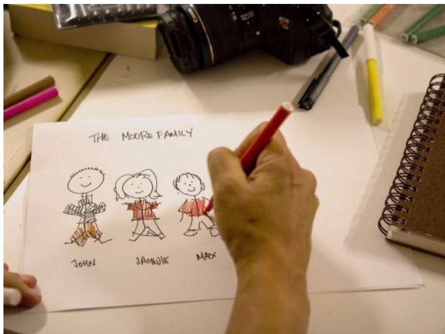
Fig. 1. Viaje Queens, NY-Madrid. Dinámica de presentación de familias en el Museo ICO con la delegación americana.

Esa primera sesión fue la ocasión para presentarnos y conocer a los niños, los padres, los educadores y fundamentalmente para hacer una primera toma de contacto con un espacio entonces desconocido para los niños y las niñas participantes, quienes sólo tenían una idea general a través de la agenda que habíamos elaborado previamente para organizar el día. A la salida de esa sesión nuestras expectativas no se habían cumplido: alguno de los niños tuvo que salir de la sala de talleres por el estrés que producía una experiencia totalmente nueva para ellos; otros corrían por las salas del museo, provocando además las quejas de algunos visitantes; los padres no parecían muy seguros de que supiéramos lo que estábamos haciendo ni encontraban su papel en el desarrollo de la actividad... En definitiva, se comprobaba la necesidad de aplicar una organización precisa por parte de todos los implicados; así, en las sesiones posteriores, donde el espacio era ya conocido, se fueron sustituyendo las carreras por las salas por la participación de unos padres implicados ejerciendo diversos roles, que indicaban a sus hijos la forma de comportarse en un museo y la definición de la rutina de trabajo