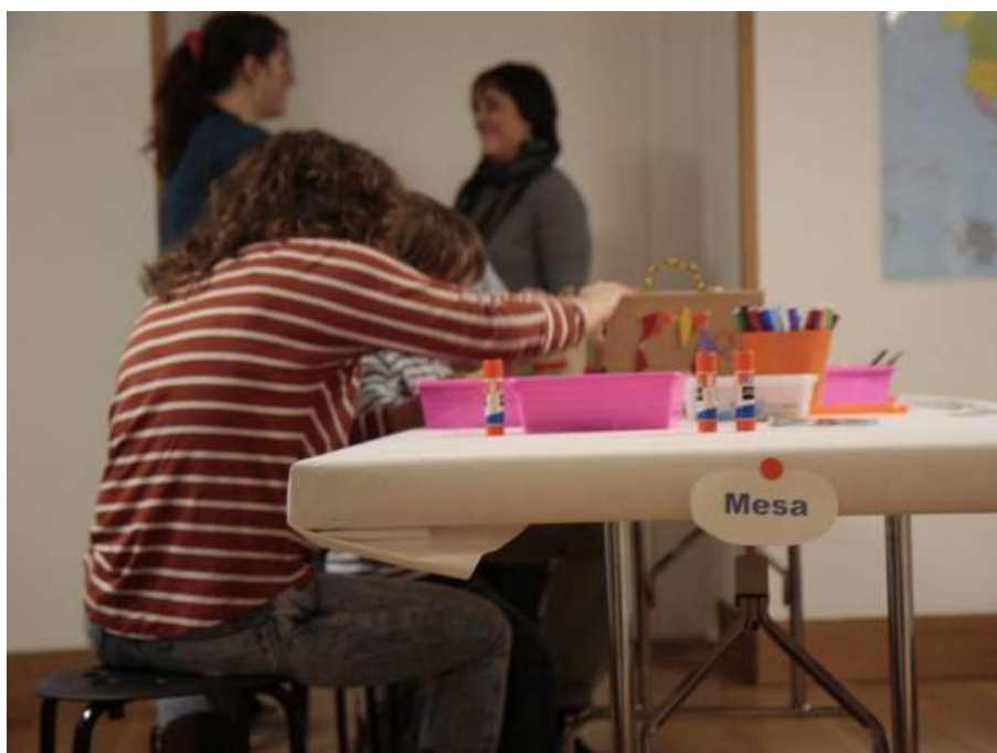
Fig. 5. Mesas de trabajo en la sala de talleres en el Museo ICO.

Todas las sesiones del programa se ajustan a una estructura común de acciones que marcan la agenda de la actividad en su desarrollo según los principios observados en el Queens Museum (fig. 4). La propia entrada al museo, por ejemplo, se concibe bajo unas pautas muy precisas: en recepción dejamos los abrigos y saludamos al resto de familias que van llegando, también allí podemos reconocer al personal de seguridad y atención al público, a quienes los niños pueden identificar por las fotos facilitadas con anterioridad para preparar su agenda diaria. El desarrollo de cada sesión se organiza, por su lado, en las siguientes fases: una vez subimos al espacio de talleres, buscamos nuestra foto sobre las mesas y nos sentamos junto a ella. Las mesas se disponen en paralelo para facilitar la comunicación entre todo el grupo y mejorar la movilidad de los adultos (fig. 5), quienes desempeñan cada día roles diferentes: desde el líder y su asistente, encargados de dirigir la sesión, hasta los responsables de mesa, de materiales o de recoger documentación gráfica de todo el proceso (fig. 6). Las dos educadoras del proyecto se integran igualmente en la rotación de funciones, apoyando el desarrollo de las sesiones desde un plano secundario.