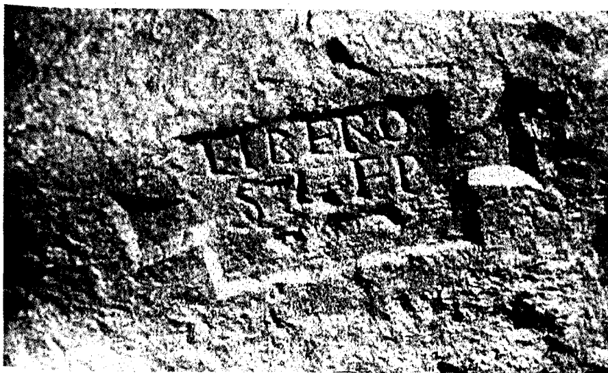
Inscripción a Liber en un cilindro de caliza. Trull, Sagunto (Valencia).