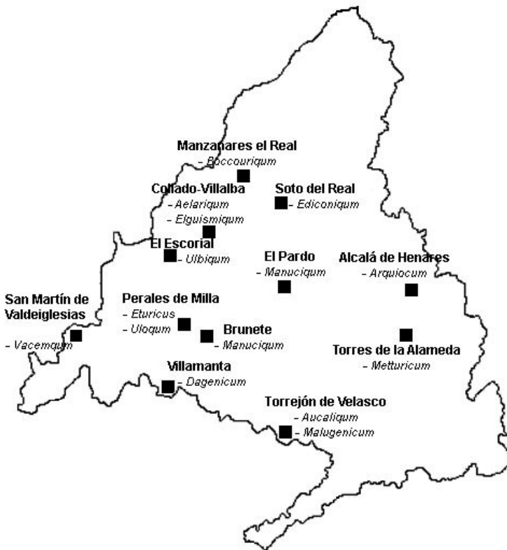
Fig. 3. Gentilidades mencionadas en los epígrafes de la Comunidad de Madrid

cogidas hasta el momento, son las siguientes: Aelariqum (citado en un epígrafe de Collado-Villalba), Arquiocum (en Alcalá de Henares), Aucaliquum (en Torrejón de Velasco), Bocoriquum (en Manzanares el Real), Dagenicum (en Villamanta), Ediconicum (en Soto del Real), Elquismiquum (en Collado-Vilalba), Eturicus (en Perales de Milla —Quijorna—), Malugeniquum (en Torrejón de Velasco), Manuciquum (en Brunete y en El Pardo), Metturicum (en Torres de la Alameda), Ulbiquum (en El Escorial), Uloqum (en Perales de Milla —Quijorna—, y Vacemqum (en San Martín de Valdeiglesias).