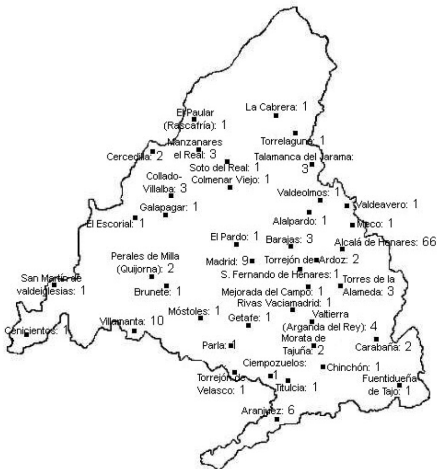
Fig. 1. Localización de los lugares de hallazgo de las inscripciones latinas en la Comunidad de Madrid con menciones onomásticas y número de epígrafes correspondientes

nerarias frente a las de otro tipo de contenido, como las votivas, las honoríficas o los miliarios, siendo precisamente las vinculadas con el culto a la muerte, las que proporcionan la mayor parte de las referencias onomásticas.