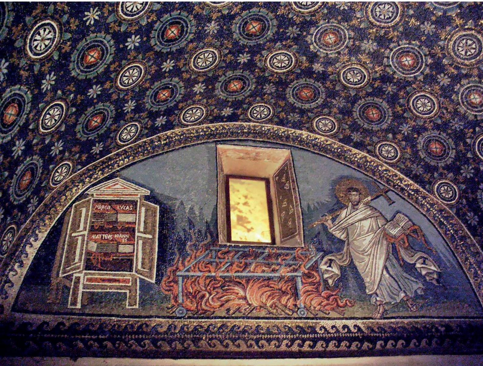
FIGURA 7. IMAGEM DO MOSAICO QUE REVESTE PARTE DO MAUSOLÉU DE GALLA PLACIDIA (RAVENNA)

for, este é o espaço onde o investimento nos índices de conforto é mais elevado, indicando que era um compartimento particularmente relevante e apreciado.