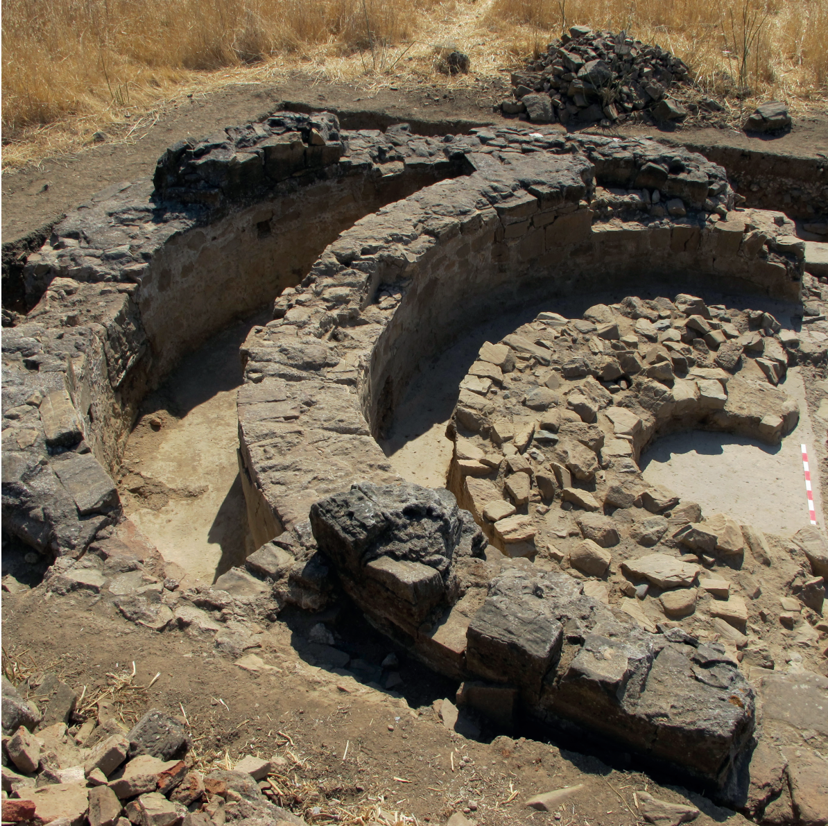
FIGURA 3. STIBADIUM DA VILLA DA HORTA DA TORRE VISTO DE NORTE Após os trabalhos de escavação realizados no Verão de 2013 da responsabilidade do autor.

água, libertada por uma comporta escondida na ábside por detrás do stibadium , e que corria livremente pela sala, que para esta finalidade se encontrava revestida por um pavimento em opus signinum robusto e de excelente qualidade, com uma meia-cana em todo o rodapé fazendo a ligação —e a fixação— das referidas placas de mármore. Neste espaço áulico, cuja escavação está no seu início, temos o aparato decorativo centrado no revestimento parietal (e eventualmente, também no tecto), mas existe uma solução de excepção que passa pelo enchimento de água do interior da estrutura, que certamente criaria uma ambiência notável recorrendo