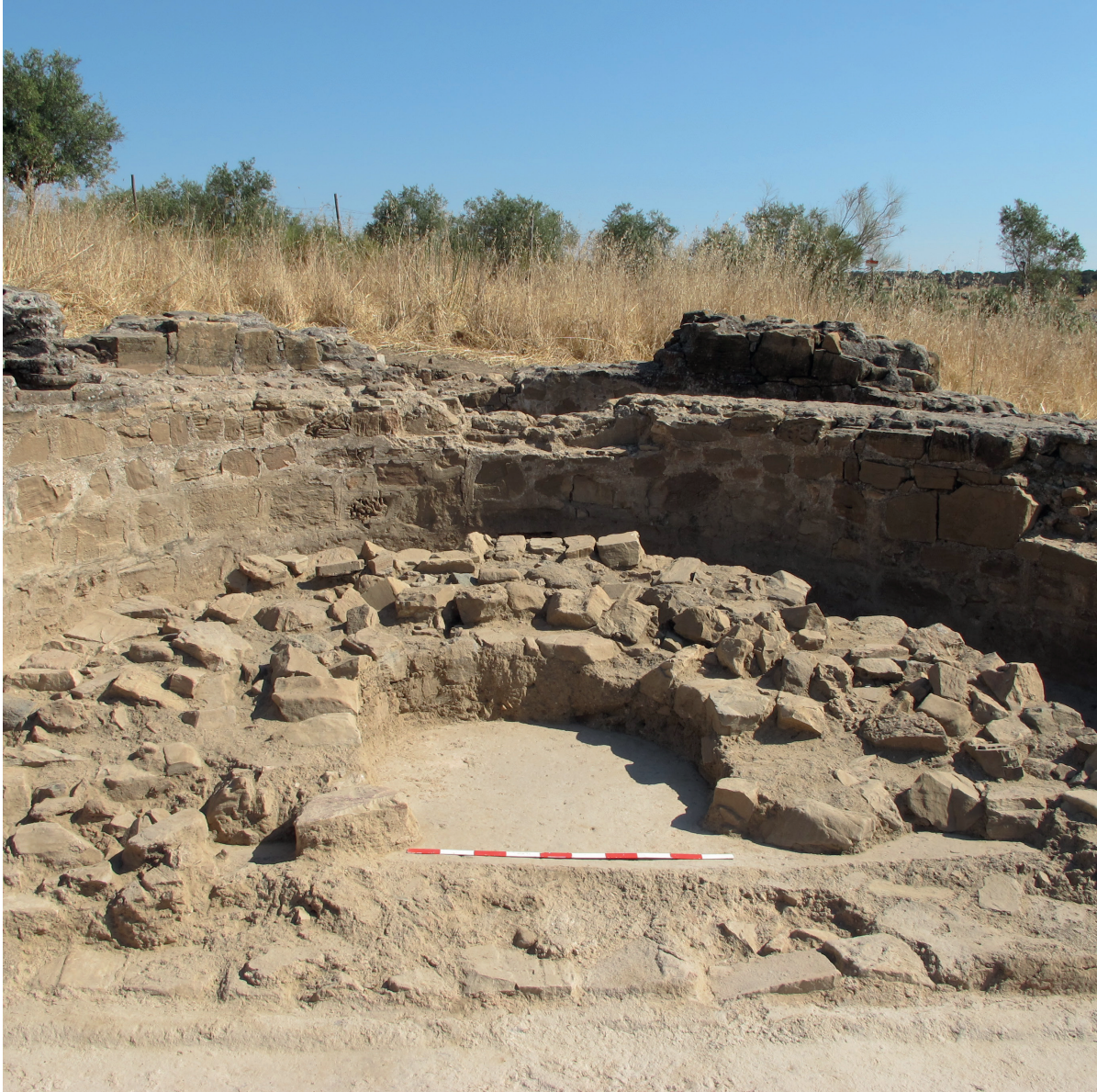
FIGURA 4. STIBADIUM DA VILLA DA HORTA DA TORRE VISTO DE OESTE Após os trabalhos de escavação realizados no Verão de 2013 da responsabilidade do autor.

aos jogos de luzes e reflexos que as lajes de mármore e os mosaicos coloridos do interior da estrutura proporcionariam 36 .