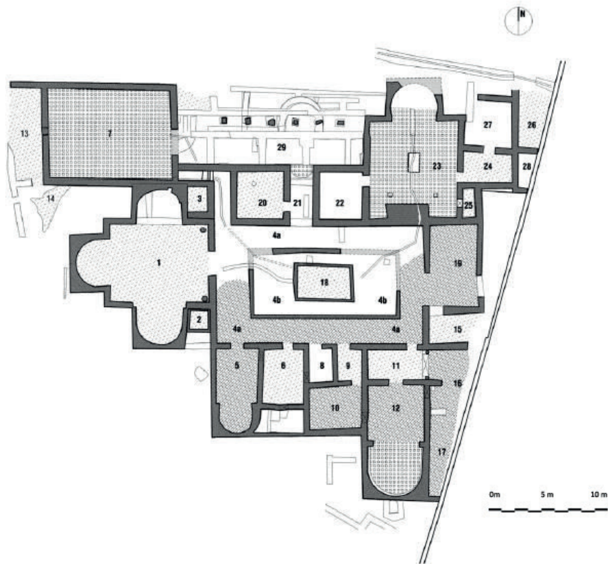
FIGURA 6. PLANTA DA PARS URBANA DA VILLA DA QUINTA DAS LONGAS.

Um esquema semelhante de utilização de água, embora com outros referentes culturais, encontra-se em Quinta das Longas, no espaço do ninfeu. O compartimento 23 ( vid. FIG. 6) foi pensado ao pormenor e demonstra a capacidade inventiva na criação de ambientes que utilizam e manipulam soluções arquitectónicas e componentes da natureza para criarem um ambiente com fortíssima carga cenográfica, que denuncia um proprietário de elevada mundividência cultural, com claro apego aos valores helenísticos e a um repertório centrado na mitologia clássica. Esta concepção do espaço concretiza-se de várias formas: desde logo, no modo como a sala era abastecida por uma cascata artificial de água, que depois inundaria todo o compartimento, recorrendo ao contraste do pavimento de opus sectile em xadrez, com alvas lajes de mármore intercaladas com negras lousas de xisto, para criar jogos cromáticos de luz e ilusão que a água realçaria. Ocupando nichos nas paredes estariam elementos escultóricos provenientes do grupo de Afrodísias 37 , ou seja, do outro extremo do Mediterrâneo, o que demonstra bem a exigência e a mundividência do encomendante, visto que se trata de uma matéria-prima existente localmente, no anticlinal de Estremoz. Estas peças compõem um ciclo