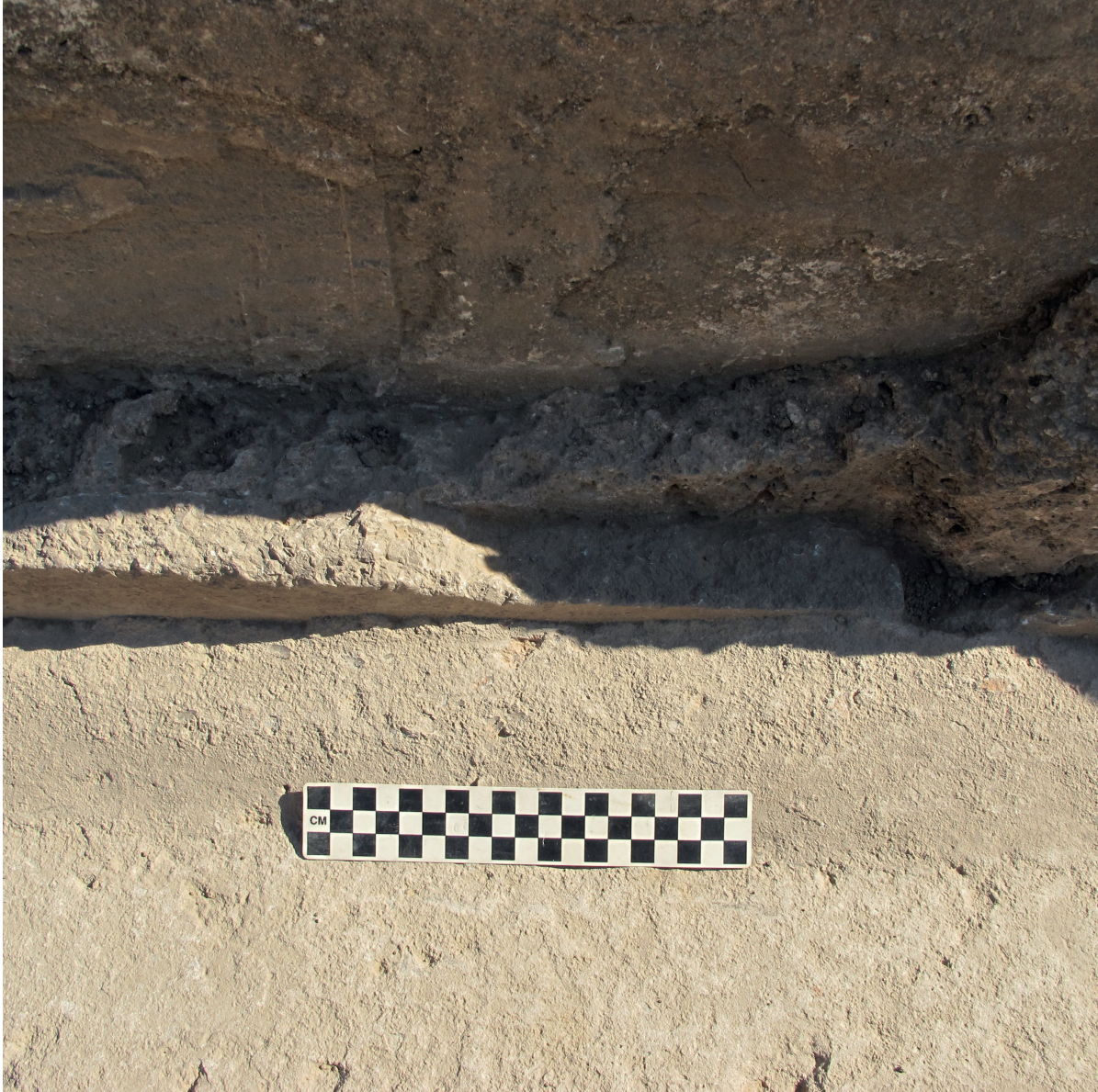
FIGURA 5. PORMENOR DO RODAPÉ EM OPUS SIGNINUM COM LAJE DE MÁRMORE NA UNIÃO À PAREDE DA GRANDE SALA IDENTIFICADA NA VILLA DA HORTA DA TORRE Após os trabalhos de escavação realizados no Verão de 2013 da responsabilidade do autor.

velut expressa cubantium pondere sipunculis effluit eavato lapide suseipitur, graeili marmore continetur atque ita occulte temperatur, ut impleat nec redundet ). Em várias ocasiões Plínio refere a tranquilidade que o som da água corrente lhe inspirava como elemento fundamental para o otium litteratum . Um caso semelhante, o único paralelo rural para o território actualmente português, encontra-se na villa de Rabaçal, onde o stibadium estava «num ambiente no qual o pavimento de mosaico de todo o tricínio estaria pronto a receber um espelho de água» (PESSOA, 2008: 145), visto que foram identificadas «5 canaletas dispostas simetricamente» interpretadas como «ponto de entrada de água» (p. 144). Refira-se ainda que na Horta da Torre o stibadium seria revestido, não em mármore, mas em estuque, como no caso bem conhecido da villa de El Ruedo (Almedinilla, Cordoba; ver VAQUERIZO GIL & NOGUERA CELDRÁN, 1997) ou o exemplo paradigmático de Faragola (Volpe, 2006), entre outros sítios semelhantes (MORVILLEZ, 1996: fig. 1–2).