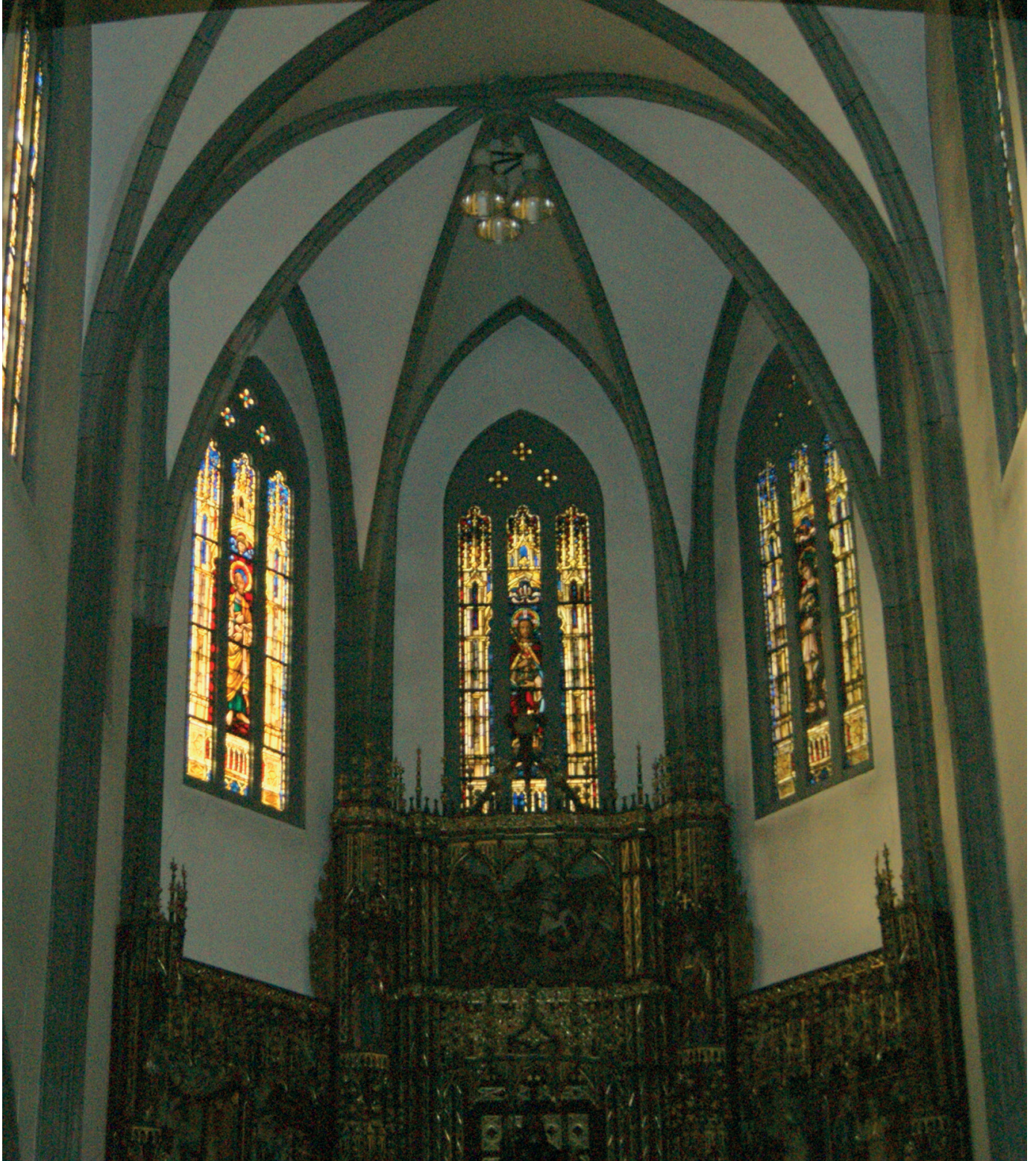
FIGURA 6. VISTA DE LAS VIDRIERAS DE LA CABECERA.