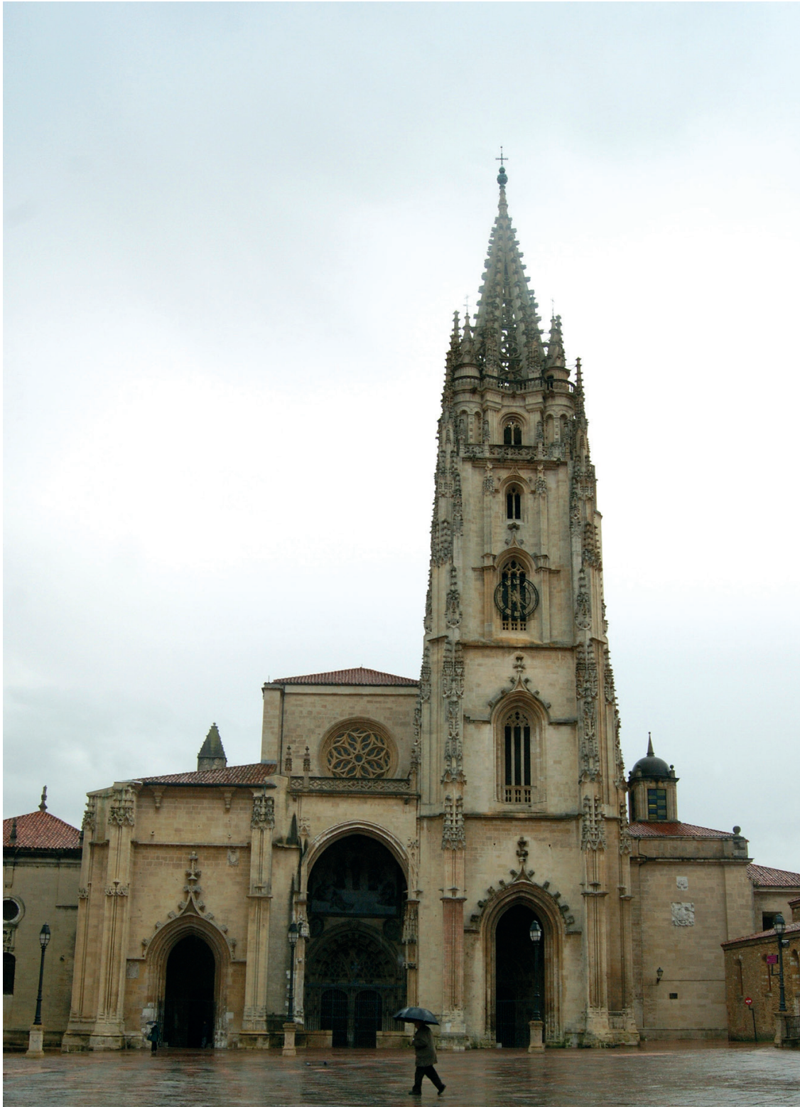
FIGURA 3. CATEDRAL DE OVIEDO.