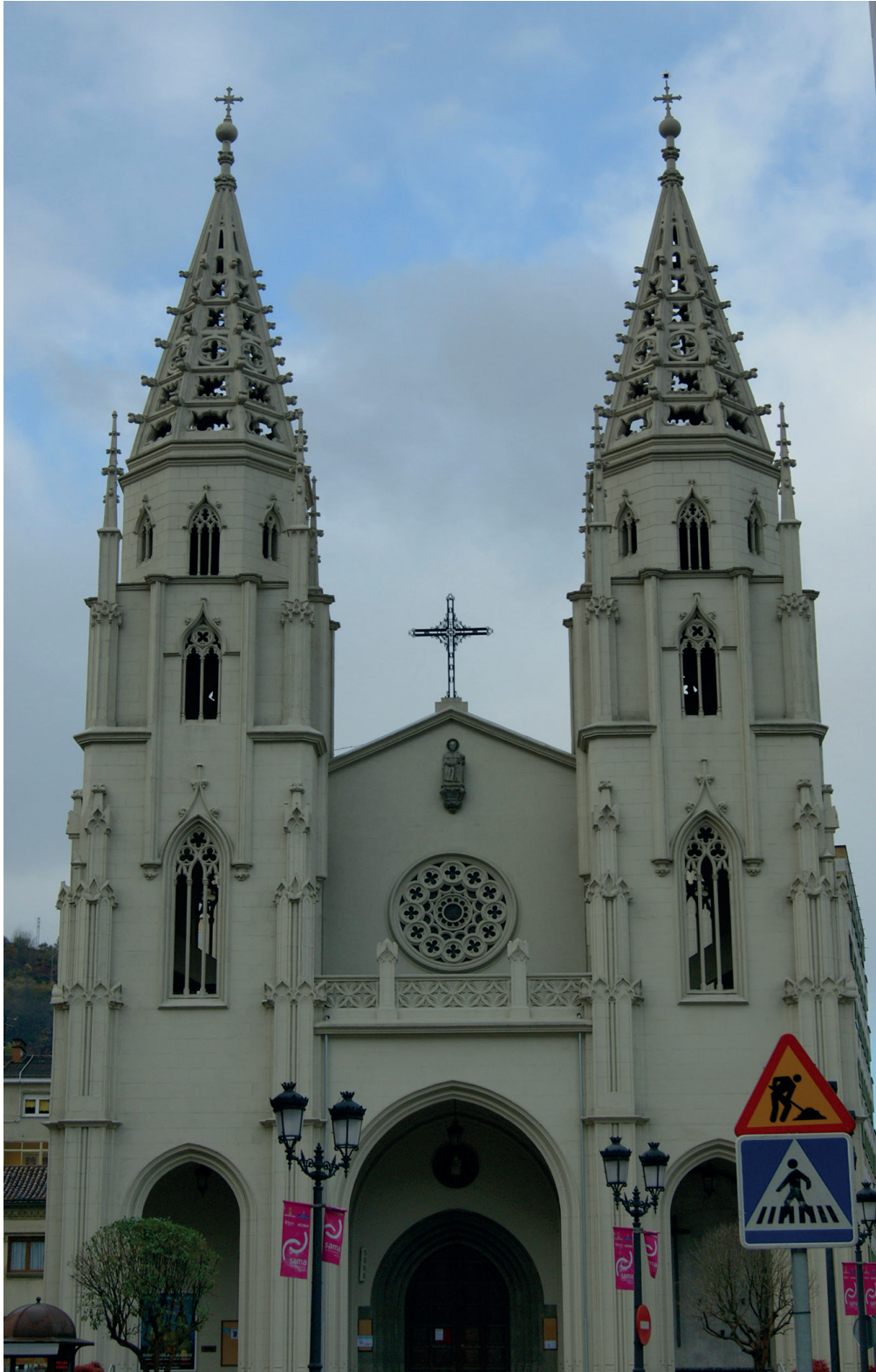
FIGURA 4. FACHADA DE LA IGLESIA PARROQUIAL DE SANTIAGO APÓSTOL.