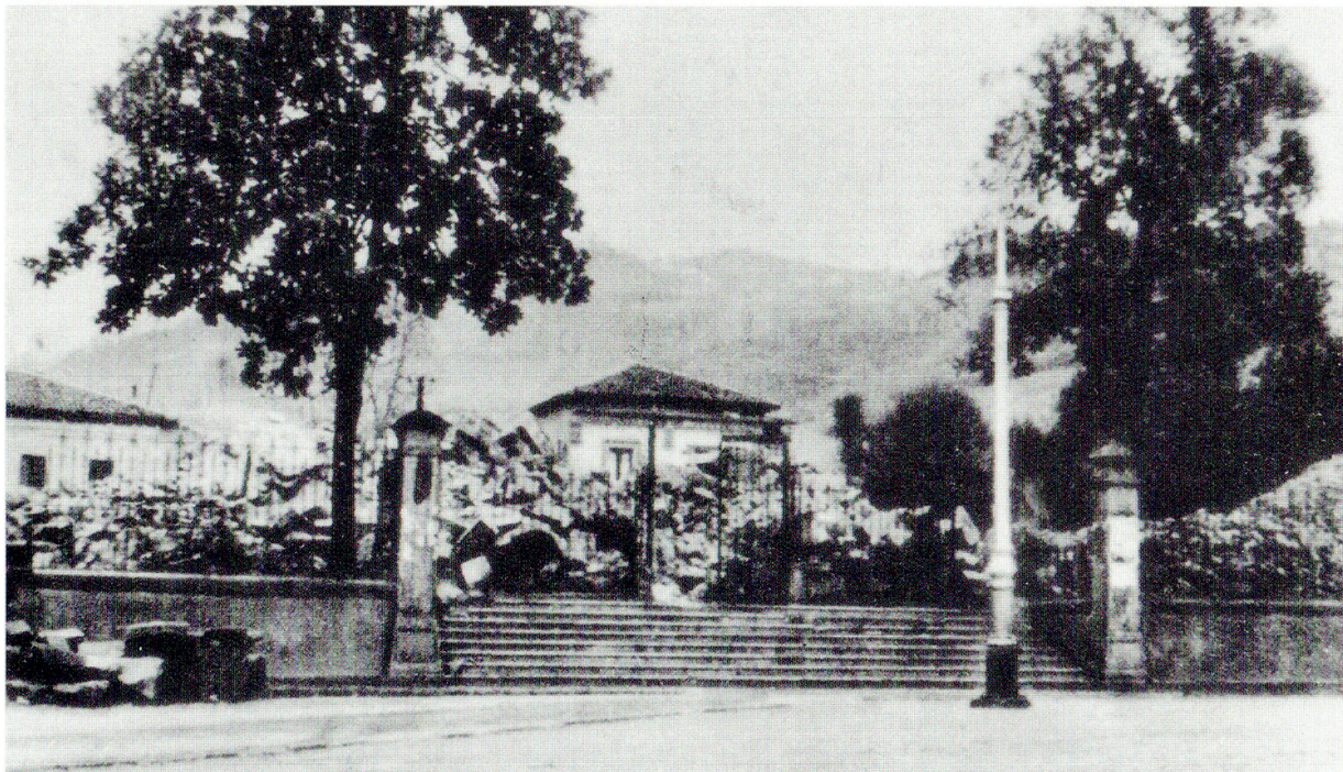
FIGURA 1. DESTRUCCIÓN DE LA IGLESIA PARROQUIAL DE SAN EULOGIO.

el anterior pues la iglesia no estaba sujeta a alineación, tal y como certificaban las obras que se hallaban fuera de los cimientos. 47