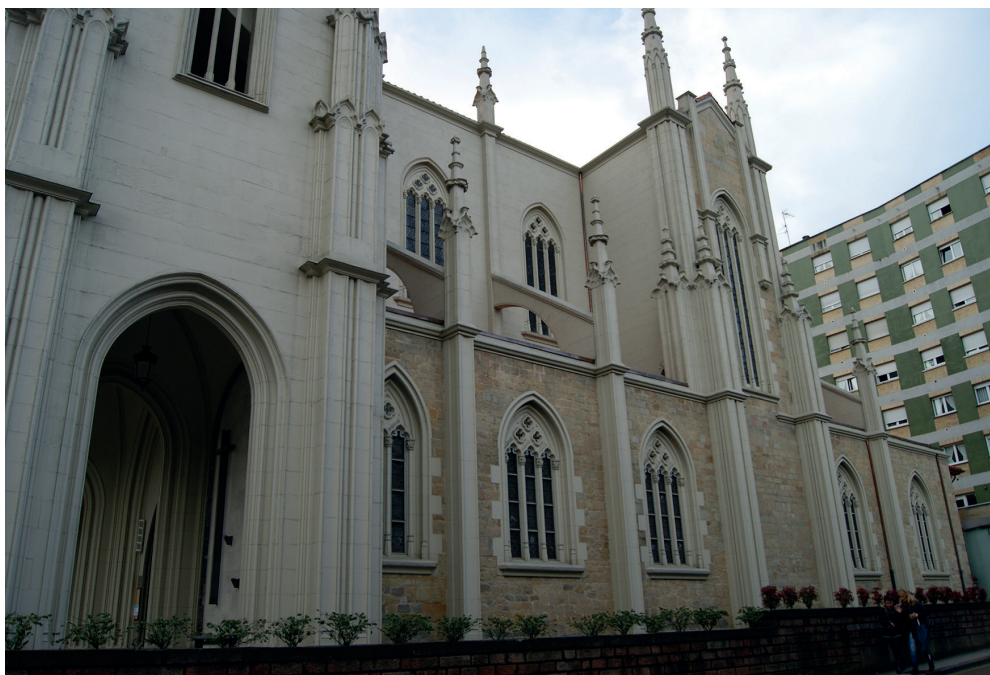
FIGURA 5. LATERAL DEL TEMPLO. VISTA DE ELEMENTOS NEOGÓTICOS.

De la misma manera, el resto de la apariencia de esta iglesia parroquial se corresponde con los modelos góticos en tanto en cuanto sus elementos arquitectónicos, como arbotantes y decoración exterior, aunque simplificada, muestran una clara reinterpretación y asimilación estilística (Figura 5).