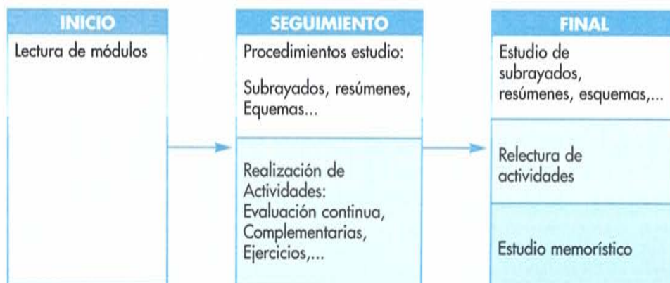
Cuadro 3. Secuencia de estudio

En resumen y de manera general, el proceso de estudio que siguen los estudiantes y, en concreto, la secuencia de actuaciones que utilizan para los tres momentos señalados (inicio, seguimiento y final) queda reflejada en el siguiente cuadro: