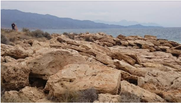
FIGURA 1. Cordones de bloques métricos imbricados en la costa de Cabo Cope (Murcia).

SE), habiéndose registrado terremotos de hasta Mw5.2 (terremoto de Lorca, 2011). No obstante, el registro sísmico instrumental de la zona de estudio muestra pocos terremotos y de baja magnitud ( \leq 4,0 Mw) y sólo dos terremotos históricos (1596 y 1882 AD) con epicentro macrosísmico en la localidad de Águilas con intensidades máximas de IV - V (Mezcua, 1982).