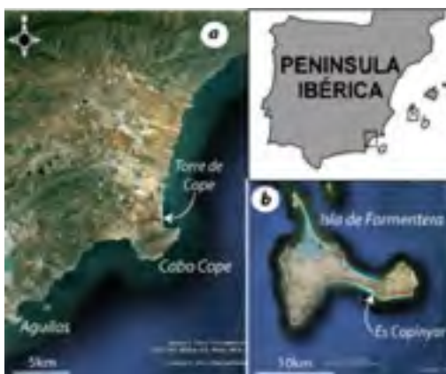
Fig. 1: Localización de las secuencias estudiadas

En Formentera (Fig. 2), se desarrolla un pequeño escalón o microacantilado (0.5-1m de alto) sobre