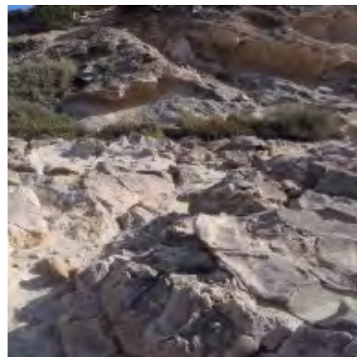
Fig. 2: Secuencia sedimentaria de Es Copinyar (Formentera). Grietas poligonales en la primera unidad y segunda unidad, de bloques, encajada