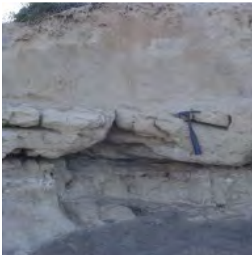
Fig. 3: Grietas poligonales en facies del upper foreshore de la primera unidad de la secuencia sedimentaria de Cope (Murcia), y la segunda unidad de dunas bioturbadas superpuesta.

En la cuenca de Cope, la primera unidad corresponde a facies oolíticas del upper foreshore , también con S. bubonius , afectada por grietas poligonales, sobre la que se superpone la segunda unidad de dunas oolíticas muy bioturbadas (Fig. 3); y por encima se desarrolla una tercera unidad de dunas oolíticas con laminación muy marcada que constituye del techo de la secuencia morfosedimentaria oolítica.