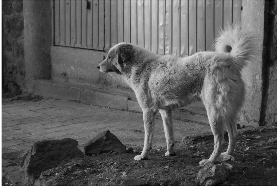
Perro en las afueras de Kigali

Sin embargo, en los diferentes manuales consultados sobre el tratamiento de cadáveres tras desastres, no se han encontrado referencias a los posibles riesgos sanitarios que representan los perros alimentándose de cadáveres sanos (FAO, 2015). En todos los casos, la conveniencia de enterramiento o incineración responde a criterios de prevención de transmisión de enfermedades como la rabia, tuberculosis, el VIH o, más recientemente el ébola (Dailymail, 2014).