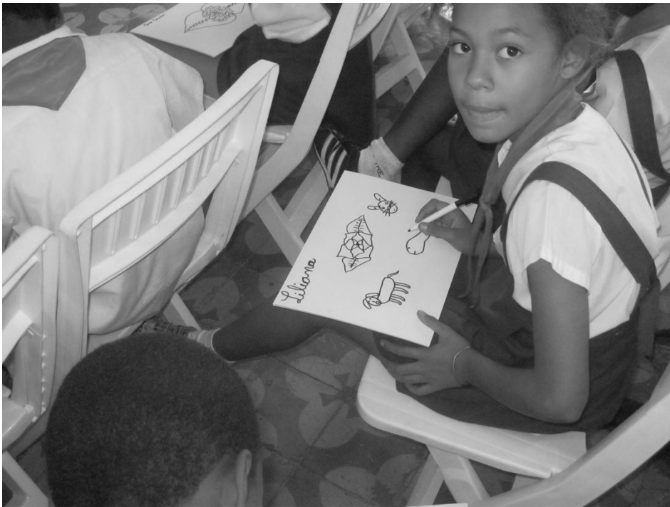
Fuente: Eduardo Barona. Proyecto educativo de la Fundación Yelcho en Cuba

Humane Education, que sí constituye un grado formalizado en algunas universidades americanas, en colaboración con la Humane Society (e.g. University of Denver 2016; Valparaiso University 2016). El hecho de que en la ERA forme parte esencial de los estudios en educación humanitaria, revelan las razones por las que insistimos en la importancia del reconocimiento de esta materia cuyos límites trascienden la barrera inter especies a favor de la empatía y la resolución de problemas desde la responsabilidad individual (Onion, 2014).