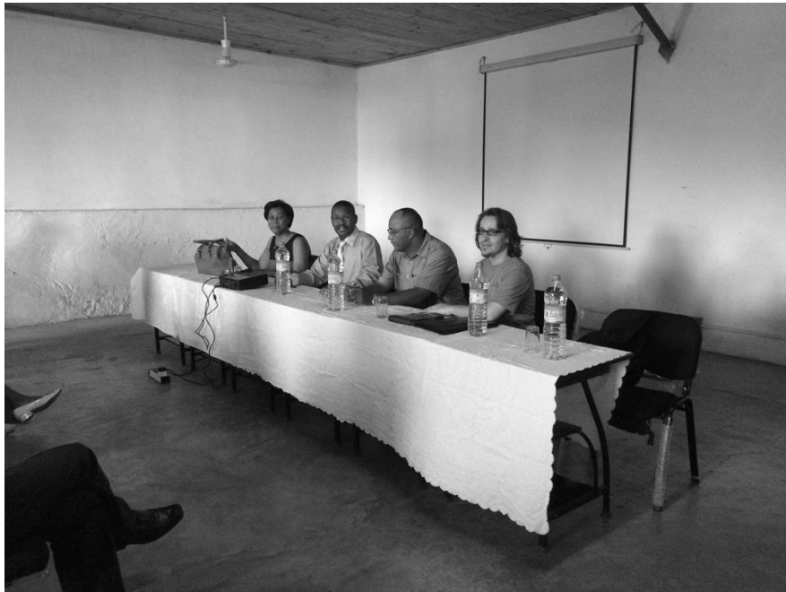
Presentación de la ERA en Universidad de Tulear (Madagascar)

Esta propuesta, constituye además una declaración de intenciones sobre el impulso de esta competencia en España, abriendo la posibilidad de nuevos estudios así como de colaboraciones con universidades extranjeras, que bien puedan dar pie a una continuidad en el desarrollo de una tesis doctoral.