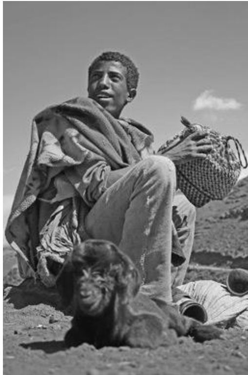
Pastor en Etiopía.