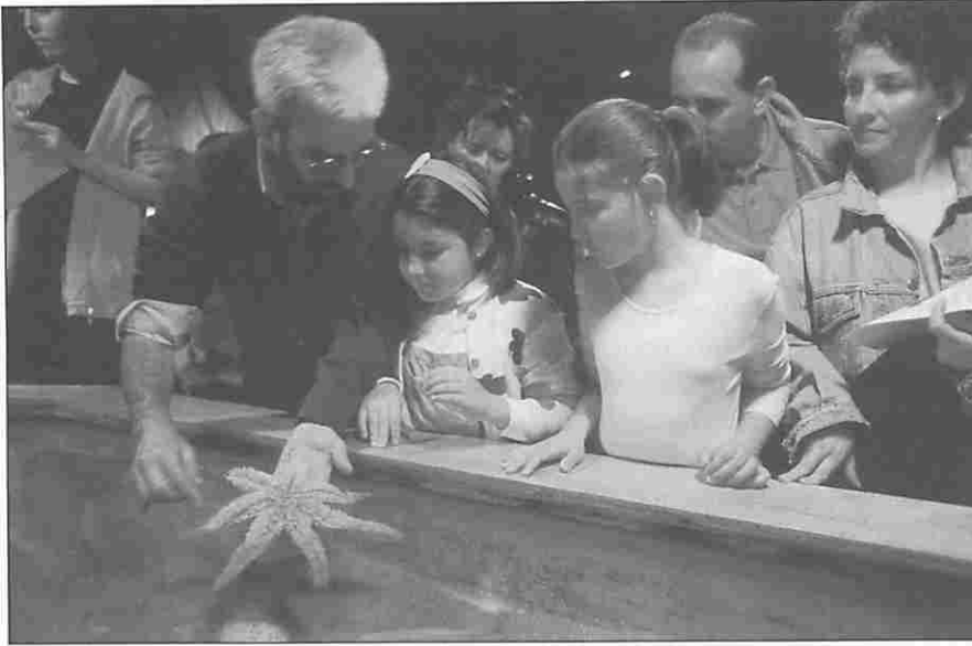
Figura 1. La "Charca de las caricias" en el Aquarium.

sapiens. Es la Domus, o Casa del Hombre. El ser humano como individuo y como especie, la anatomía y fisiología de su cuerpo, la genética, el desarrollo, su origen y evolución, su interacción con el medio, sus singularidades y diferencias, la etología humana, la demografía o la antropología son algunos de los campos que dieron contenidos a este nuevo centro. El tercer hito en el desarrollo de las instalaciones coruñesas de divulgación científica estaría dedicada a la educación ecológica, buscando despertar en los ciudadanos actitudes de respeto y protección al medio ambiente. Es la Casa de los Peces, o Aquarium Finisterrae, y fue inaugurado el 5 de junio de 1999, Día Mundial del Medio Ambiente, fecha que coincidió además con el bicentenario de la partida del puerto de La Coruña del naturalista Alexander von Humboldt en su histórico viaje de descubrimiento científico de América.