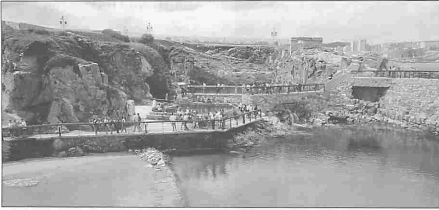
Figura 10. El "Paraíso Marino".