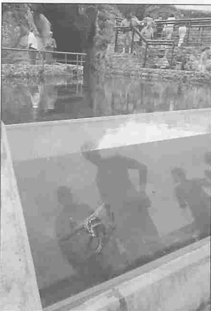
Figura 11. El "Jardín de los pulpos".

El Aquarium contiene también grandes áreas de esparcimiento al aire libre en las que se desarrollan actividades museísticas, como la exposición de instrumentos de pesca, la instalación de carteles informativos con, por ejemplo, las características de las gaviotas, los cormoranes o los albatros que se posan en la roca vecina y que pueden avistarse mediante telescopios instalados en la terraza exterior, un reloj de sol que utiliza la propia sombra del visitante para indicar la hora, un aparato para medir la altura de las olas y determinar el tipo de oleaje, o un indicador de direcciones y distancias a otros puertos del Atlántico.