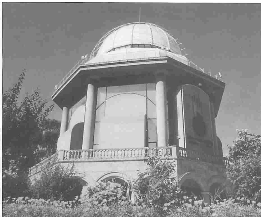
Figura 3. La Casa de las Ciencias.

reflexión acerca de las características de la especie humana.