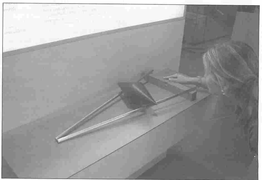
Figura 12. Experimento: "Subir bajando".

Los Museos Científicos Coruñeses también desarrollan otras actividades que no son propiamente museográficas. Destacan dos de ellas: los Prismas Casa de las Ciencias a la Divulgación, y la serie de Monografías de Comunicación Científica. La primera de ellas es una iniciativa nacida en 1988 como un certamen de vídeo científico que tenía la finalidad de apoyar a todos los profesionales que trabajaban en este campo. El éxito de las primeras convocatorias y las innovaciones y tendencias en los medios de divulgación de la ciencia, provocó que se