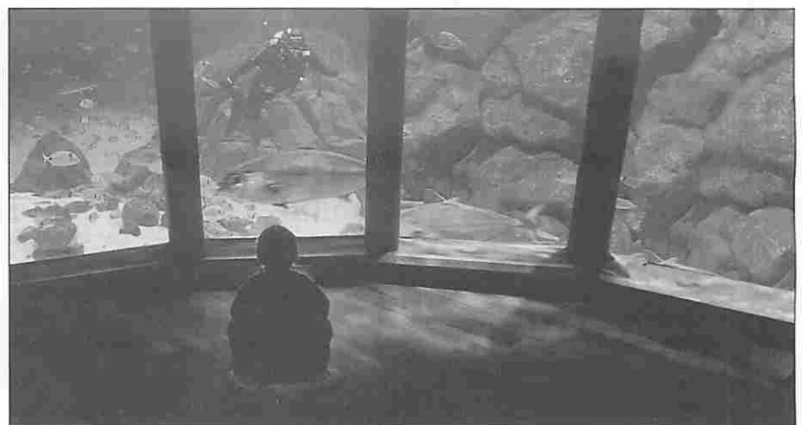
Figura 2. La Sala Nautilus.

La Domus fue el primer museo interactivo del mundo que abordó de forma global y monográfica el ser humano, buscando divertir al visitante, estimular su curiosidad y suscitar su