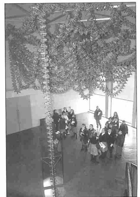
Figura 9. Modelo gigante del gen de la telomerasa.

“Caballitos en la mar” descubre a muchos de sus visitantes que estos animales pertenecen al grupo de los peces, aunque sus peculiares características, como el hecho de que sean los únicos peces con cuello, tengan una cabeza con un largo hocico en forma tubular, naden en posición erguida o que los machos sean los que se quedan embarazados, lleven a pensar otra cosa.