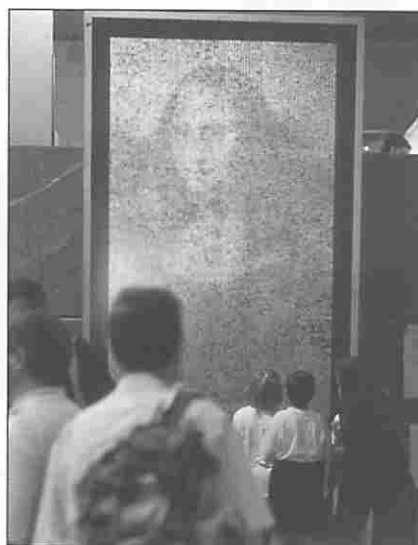
Figura 6. Reproducción de “La Gioconda” a partir de más de 10.000 fotografías de visitantes.

buyen en dos salas de exposiciones (Maremágnum, con 1.500 metros cuadrados para exposiciones permanentes, y Sala Humboldt, de exposiciones temporales), una sala de observación –Nautilus– inmersa en una piscina de 4,5 millones de litros, piscinas abiertas en las que se presentan la flora y fauna de las costas gallegas y del Atlántico, una terraza con módulos expositivos al aire libre y un jardín botánico de plantas de litoral.