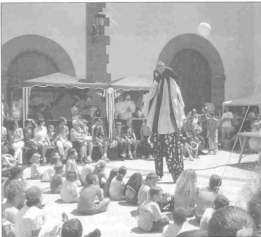
Momento del Espectáculo "Calle con Ciencia" en una Plaza de la Laguna.

nente como en las actividades, que más abajo describiré. Además concurre otro aspecto, quizás menos aparente para el visitante, pero especialmente importante por varios motivos. Se trata del hecho de que todos los contenidos se diseñan, desarrollan y se construyen en su mayor parte en las propias dependencias del Museo, y su importancia radica no sólo en la facilidad de efectuar un mantenimiento adecuado (que no es poco) o en la garantía de que los experimentos resistirán bastante tiempo el vapuleo a que son sometidos por los visitantes, sino también en el hecho de que cada avance, cada nuevo proyecto es compartido por todos los integrantes de la plantilla y llevado adelante con las contribuciones de todos los departamentos, como son los de dirección, desarrollo, mantenimiento y didáctica, y sentido como propio por todos sus miembros. Se puede decir que se palpa tanto el entusiasmo como el orgullo de todos cuando se alcanza la meta de añadir un nuevo módulo al Museo.