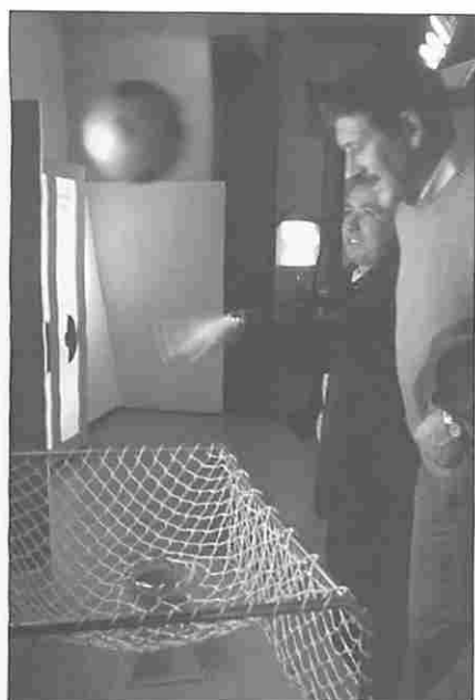
Figura 13. El "Túnel de viento".

fueran añadiendo otras modalidades. Actualmente contempla cuatro: trabajos multimedia, artículos periodísticos, libros editados y textos inéditos. Los Prismas Casa de las Ciencias, con 15 años de historia a sus espaldas y más de 1.600 trabajos recibidos desde más de 20 países, se han consolidado como unos premios únicos en su especie.