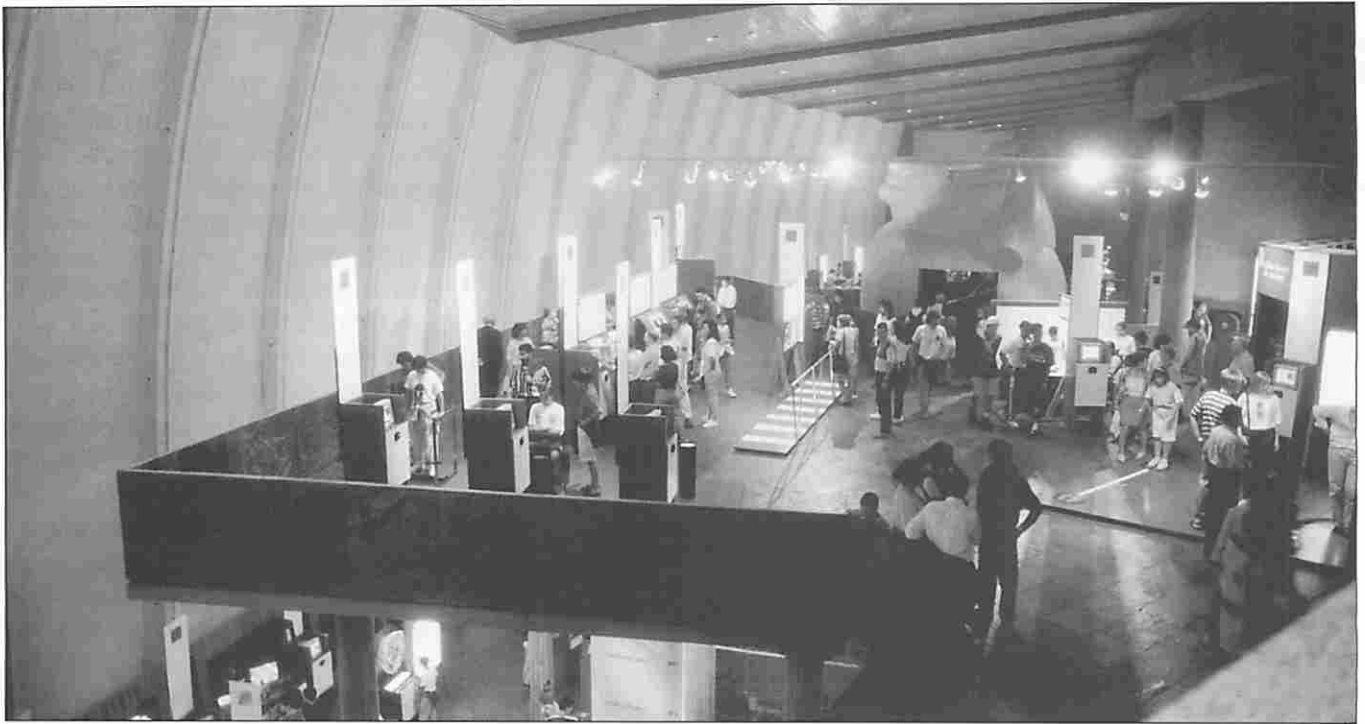
Figura 5. Imagen del interior de la Domus.

adecuada para el documental de naturaleza y científico. Actualmente se proyectan dos películas. “El Cuerpo Humano”, es una producción de la BBC que cuenta la historia de un día en nuestra vida desde una perspectiva nunca vista en la historia del cine, utilizando innovadoras técnicas de filmación combinadas con las más recientes imágenes médicas y científicas.