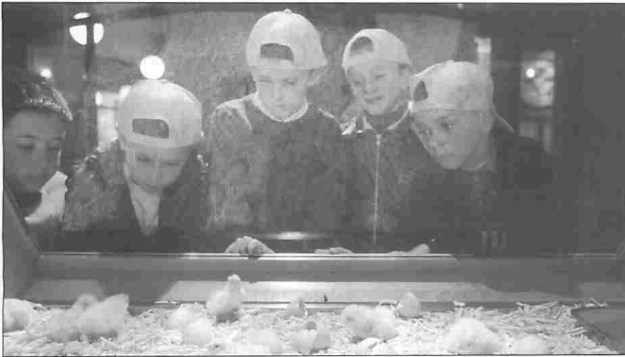
Figura 7. Incubadora.

radas donde se puede observar el comportamiento durante el día y la noche de varias especies—, o el módulo “Canciones de la mar”—en el que se pueden escuchar canciones marineras de todas las costas de la Península Ibérica— forman parte de la propuesta divergente e interdisciplinar de esta sala.