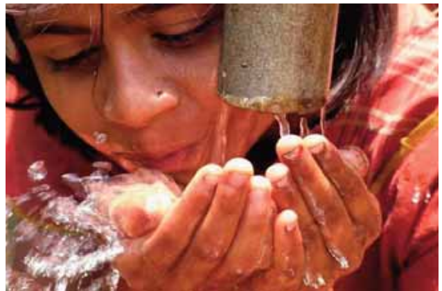
Figura 3. Enfermedad de los niños azules.

Cuando la metahemoglobinemia es elevada, la primera manifestación clínica es la cianosis, generalmente asociada a una tonalidad azulada de la piel, por lo que la enfermedad se la conoce como «enfermedad de los niños azules». Los síntomas son los siguientes: si la MHb es mayor del 10% de la Hb total, se producen dolores de cabeza, debilidad, taquicardias y falta de respiración. Si es mayor del 50%, da lugar a hipoxemia grave y a depresión del sistema nervioso central, y cuando es mayor del 70%, puede llegar a causar la muerte.