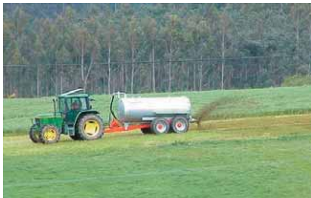
Figura 1. Aplicación de purines en la agricultura.

La forma amoniacal se absorbe muy fuertemente por el suelo salvo en los calcáreos; en cambio, los nitratos son muy móviles y se disuelven fácilmente por lavado. El problema se complica con la nitrificación permanente del nitrógeno amoniacal, es decir, con su paso a nitrato y nitrito en función del tiempo.