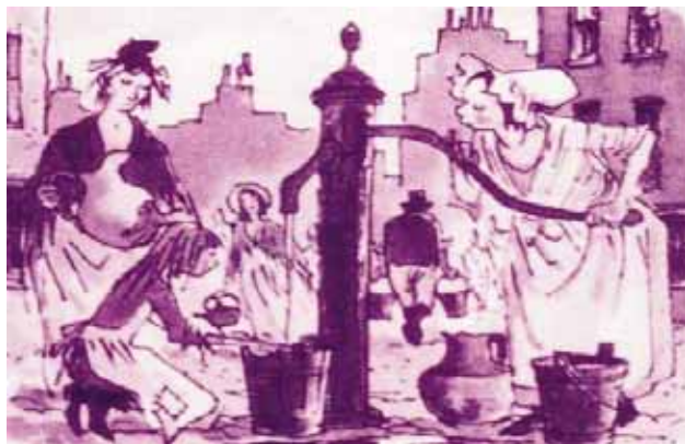
Fuente pública para el consumo.

Por todos es sabido que el agua es el origen de todos los procesos biológicos y ecológicos y es el elemento esencial para el desarrollo de la vida en el planeta. Desde la época antigua, se hacen referencias específicas al agua. Aristóteles define el agua como uno de los cuatro elementos básicos de la creación, junto con la tierra, el aire y el fuego. Nuestras vidas por completo dependen de ella, no es concebible ninguna actividad que no gire alrededor de este preciado líquido, ciudades, industrias, cultivos, etc.