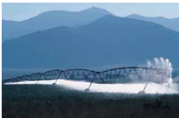
Figura 4. Riego por aspersión.

En cuanto al tratamiento de las aguas residuales urbanas la vigilancia se centra en el cumplimiento del RD-Ley 11/1995, de 28 de diciembre, por el que se establecen las Normas Aplicables al Tratamiento de las Aguas Residuales Urbanas , y del RD 509/1996, de 15 de marzo, que lo desarrolla.