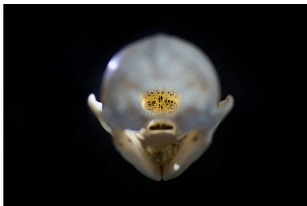
Primer Premio del XIII concurso de fotografía científica: "Cíclope del olfato". Autor: Luis Ríos Frutos.