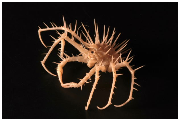
Segundo Premio del XIII concurso de fotografía científica: "Crustáceo abisal". Autor: Juan Höfer.