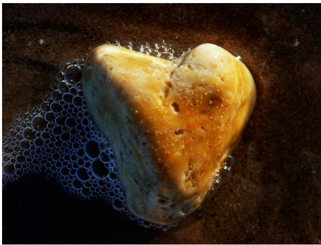
Tercer Premio (ex aequo) del XIII concurso de fotografía científica: "Bula Matadi". Autora: Julia Arroyo Carpes.