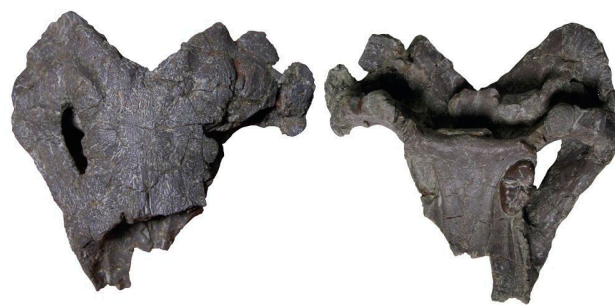
Figura 2. Holotipo del nuevo placodonto Parahenodus atancensis , del Triásico Superior de El Atance (Guadalajara), en vistas dorsal y ventral.

[1] Stubbs TL, Benton MJ (2016). Ecomorphological diversifications of Mesozoic marine reptiles: the roles