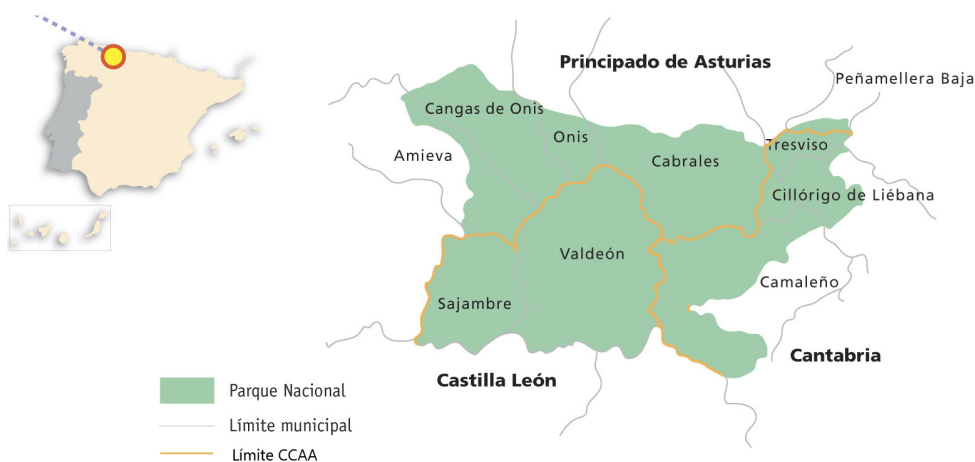
Ilustración 1. Localización Geográfica del PNPE

Fuente 1 Reelaboración del mapa publicado en el Folleto Divulgativo del PNPE