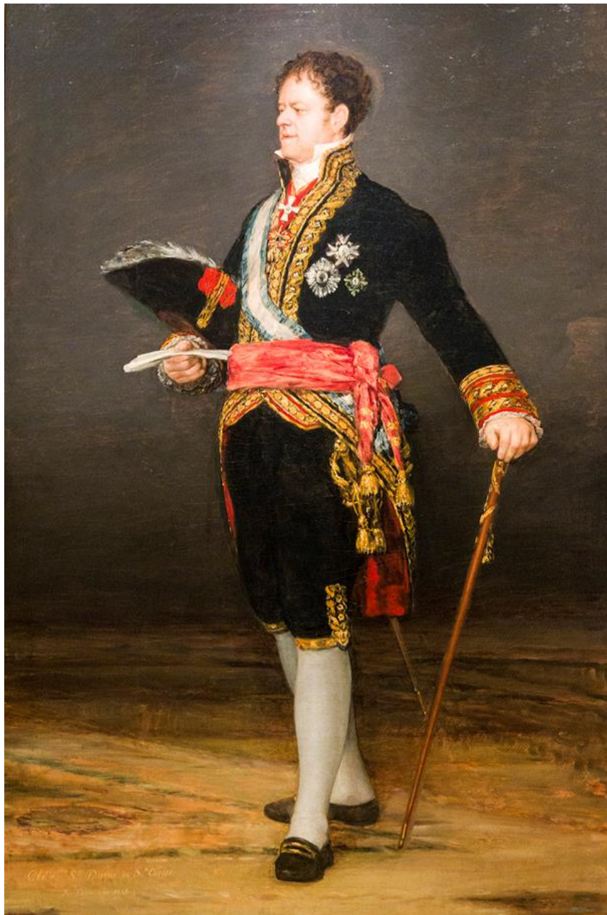
Ilustración 1. Retrato del duque de San Carlos. Francisco de Goya. Museo de Zaragoza.

Las dificultades identificadas en el estudio de la monarquía de Fernando VII se repiten e incrementan a la hora de estudiar a los protagonistas de la época: complejidad