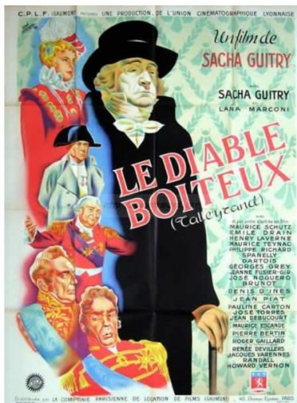
Ilustración 2. Cartel de la película «Le diable boiteux (Talleyrand)» (1948) Director: Sacha Guitry

Además, sus largos periodos de tiempo el exterior, en el ejercicio de misiones diplomáticas, vienen a favorecer este mayor conocimiento foráneo a la vez que se trata de una circunstancia por la que se hace aún más necesario acudir a fuentes y estudios extranjeros donde localizar datos que enriquezcan una investigación sobre su figura.