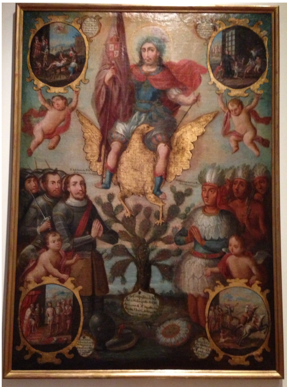
Figura 6: San Hipólito y las armas mexicanas , siglo XVIII. Óleo sobre tela, 168.5 cm × 120 cm, Museo Franz Mayer, Ciudad de México.