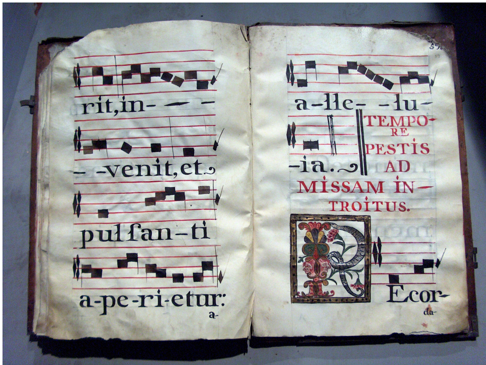
Figura 12: Libro de coro de la Catedral de México. ACMAM, Varia 11, Varia, oficio, misas y devotivas, fs. 58v-59, 1791.