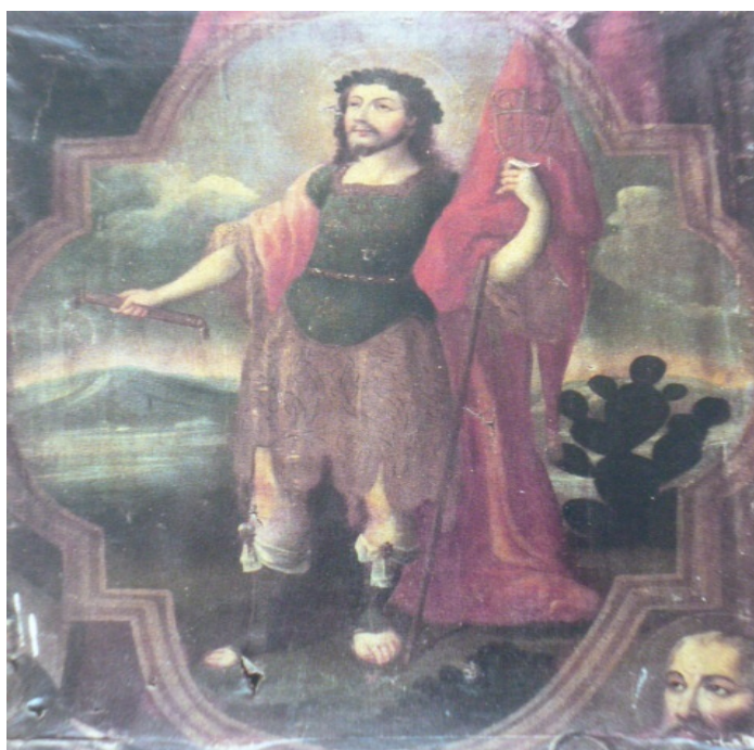
Figura 5: Anónimo, San Hipólito. Óleo sobre tela, 140.5 cm ×105 cm, Parróquia de la Asunción de Maria, Ciudad de México, Reproducida a color en Juegos de ingenio y agudeza. La pintura emblemática de la Nueva España , 1994, p. 380.

que existen varias parroquias del mismo nombre, por lo que no disponemos de más información sobre esta obra.