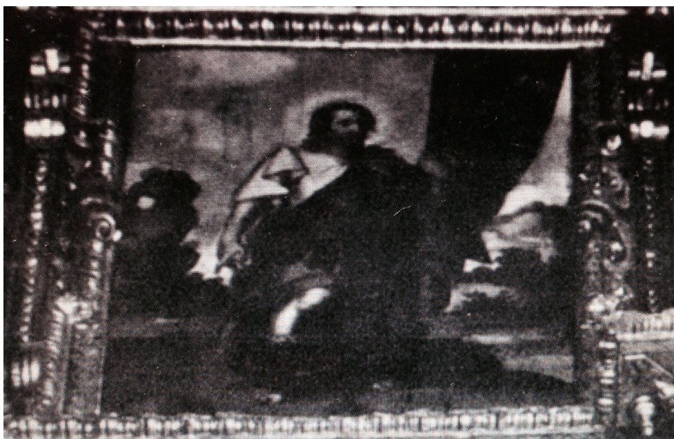
Figura 4: Sebastián López de Arteaga, San Hipólito, 1661. Reproducida en blanco y negro por RUIZ GOMAR, 1993, entre pp. 26 y 27.