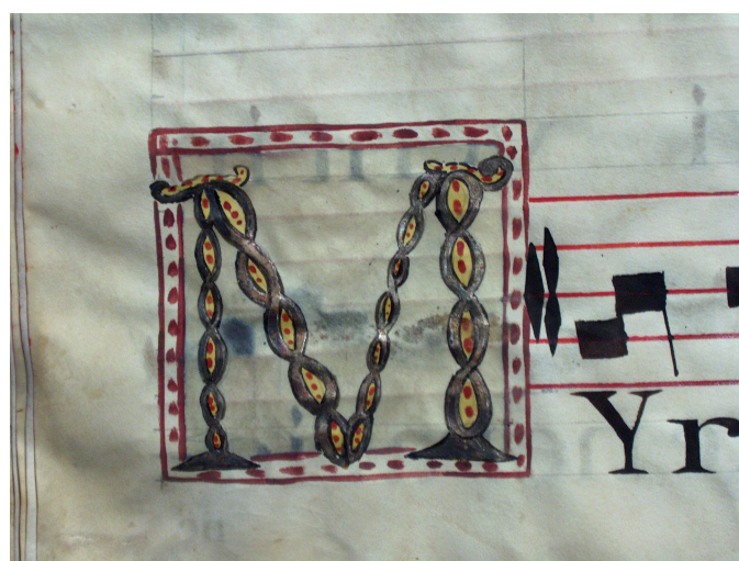
Figura 11: Letra inicial iluminada M (Detalle de la lamina 10), f. 44v.