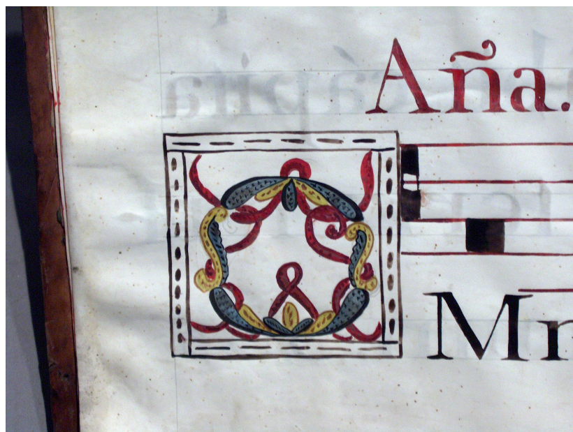
Figura 14: Letra inicial iluminada O, ACMAM, Varia 11, Varia, oficio, misas y devotivas, f. 5v, 1791.