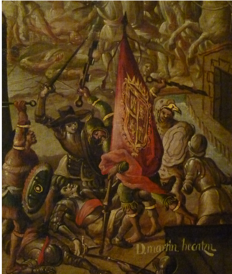
Figura 18: El estandarte real en el campo de batalla. Detalle del biombo “la conquista de México”.