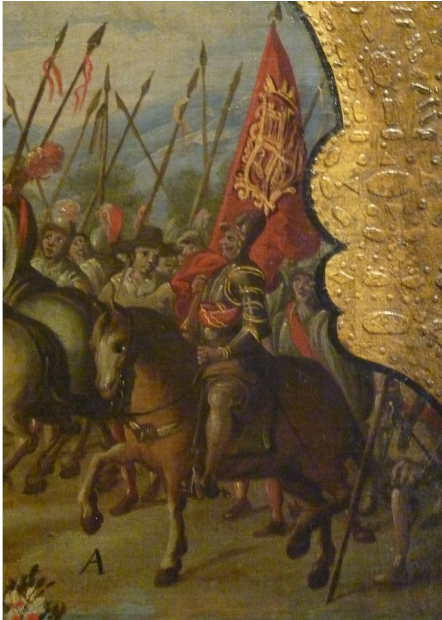
Figura 17: El alférez a caballo, portando el estandarte real. Detalle del biombo “la conquista de México”.