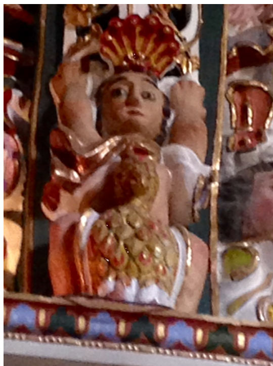
Figura 15. Anónimo, San Hipólito encima del águila dorada, Iglesia de Santa María Tonantzintla, Puebla, México.

Fuera de la ciudad de México se halla una imagen de San Hipólito en la iglesia de Santa María Tonantzintla, en el Estado de Puebla, México (Figura 13). La iglesia es una joya arquitectónica del México barroco y su construcción data del siglo XVI 146 . Se piensa que para finales del siglo XVII y comienzos del siglo XVIII se realizaron las labores decorativas con estuco del interior del recinto.