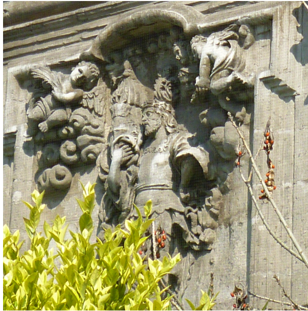
Figura 2: San Hipólito portando el pendón. Templo de San Hipólito, México D. F., México. La fotografía ha sido tomada por la autora en la propia ciudad.

Desde muy a principios de la vida colonial, se les otorgó a los plateros de la calle de San Francisco el privilegio de llevar el santo en la procesión del Corpus Christi y del día de San Hipólito y su víspera, según consta en la sesión de cabildo del 18 de marzo de 1537: