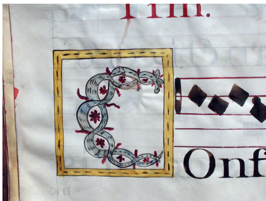
Figura 15: Letra inicial iluminada C, ACMAM, Varia 11, Varia, oficio, misas y devotivas, f. 7v, 1791.