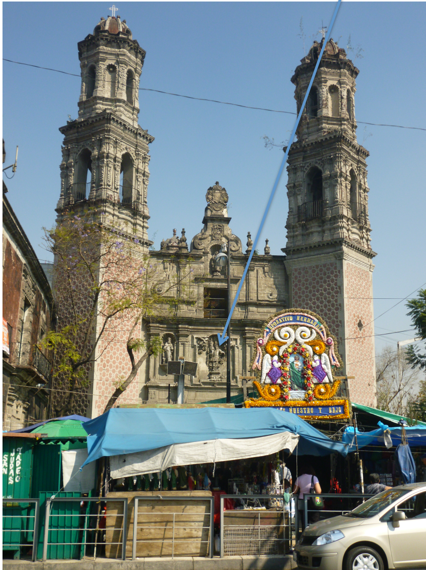
Lámina 1: La fachada del templo de San Hipólito, México D. F., México.