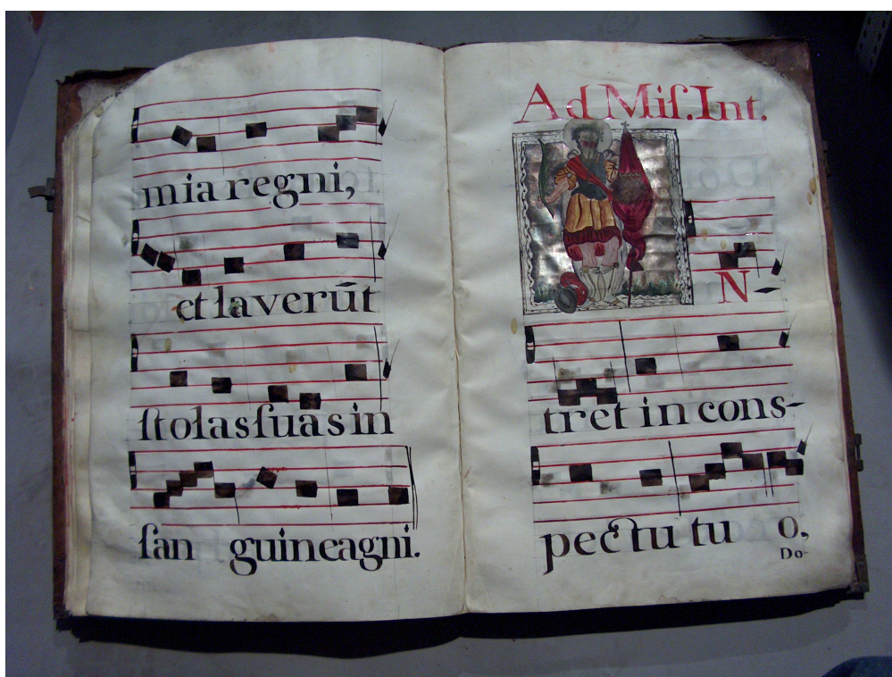
Figura 8: Libro de coro de la Catedral de México, ACMAM, Varia 11, Varia, oficio, misas y devotivas, fs. 37v-38, 1791.

La imagen de San Hipólito en cuestión aparece pintada a color con el trasfondo pintado profusamente de plata (Figura 8 y 9). En este pequeño cuadro San Hipólito está de pie y en posición erguida, pues representa la letra I. Está vestido de soldado romano con sus armaduras, portando el pendón de color carmesí con el escudo dorado, probablemente, de Castilla. Tanto el uso de la plata como el dibujo del personaje hacen que el libro y el canto sean singulares para la época.