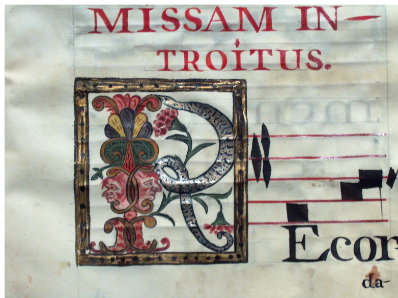
Figura 13: Letra inicial iluminada R (Detalle de la lamina 12).