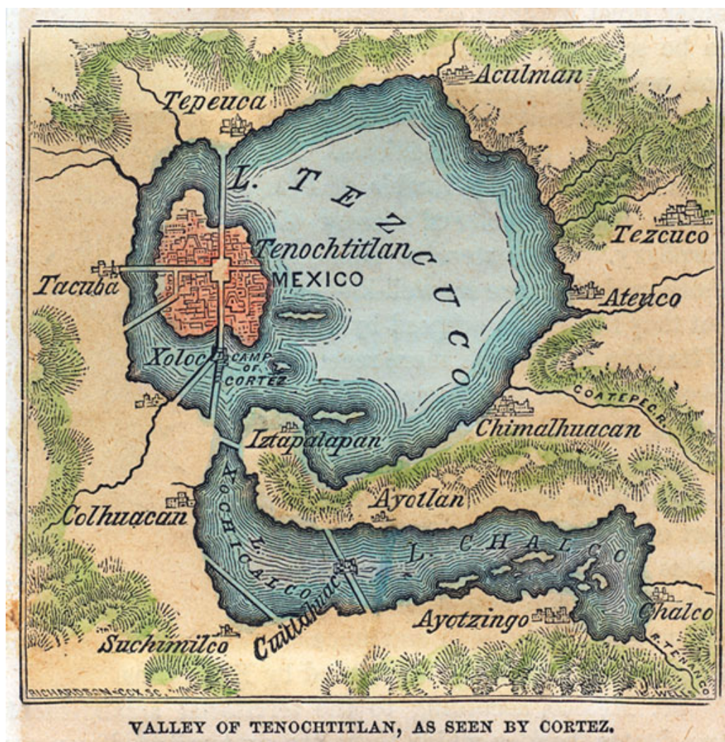
Figura 21: La valle de México-Tenochtitlán vista por Cortés, publicada en 1869 por el George F. Cram en Illinois, EEUU. Reproducida en http://www.mexicolore.co.uk/images-5/593_02_2.jpg

A lo largo de esta ruta de Tacuba se establecieron Hernán Cortés, su paje Pedro Meneses, Bernardino Vázquez de Tapia (el alférez general en el momento de la toma de México) 589 , Juan Jaramillo (el primer alférez que sacó el pendón el día de la fiesta de San Hipólito), Francisco Maldonado