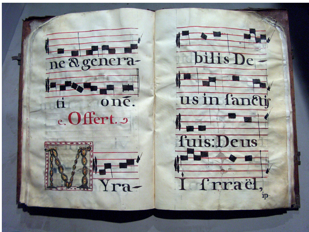
Figura 10: Libro de coro de la Catedral de México, ACMAM, Varia 11, Varia, oficio, misas y devotivas. fs. 44v-45, 1791.