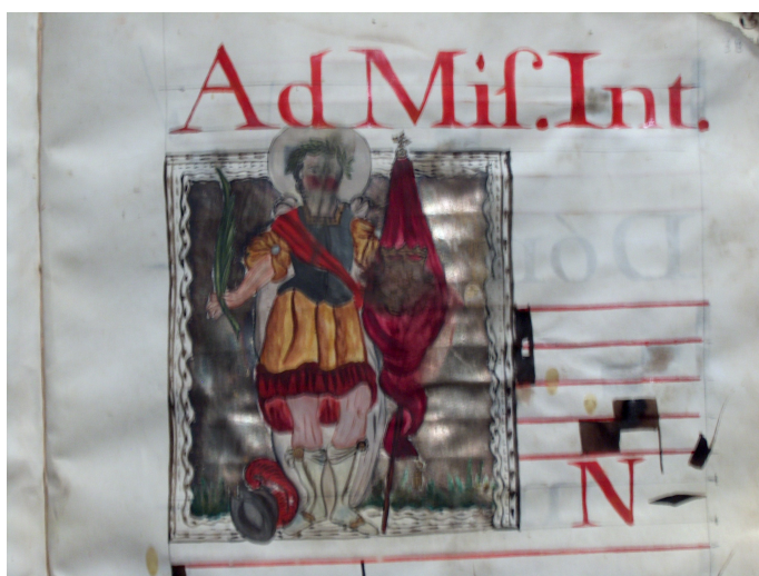
Figura 9: San Hipólito. (Detalle de la Figura 8).

Conviene detenernos a observar otras figuras, pues vemos algunos motivos pictóricos que bien pueden asociarse con los elementos de la leyenda de la fundación de México antiguo. Así vemos en la figura 10, podemos observar cuatro serpientes entrelazadas, 2 amarillas y 2 plateadas, entre sí, y al mismo tiempo formando las hojas de nopal, o bien produciendo un efecto visual de que como si subiesen el árbol del nopal, planta mítica de la fundación de Tenochtitlán 144 . Estas elipses se asemejan a las tunas, frutos del nopal, como se muestra en las figuras 10, 11, 14 y 15, que se adoptaron para el escudo de armas de la ciudad de México, otorgado por la Corona en 1523 145 . O bien podemos ver la imagen de una serpiente, elemento mítico de la leyenda azteca en las figuras 12 y 13. En las figuras 10, 11, 14 y 15 podemos observar varias serpientes plateadas y amarillas entrelazadas, entre sí, subiendo el árbol del nopal.