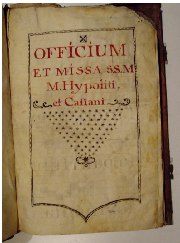
Figura 7: Portada del libro de coro de la Catedral de México para la misa de San Hipólito. ACMAM, Varia 11.

Dicho libro de coro contiene 39 iluminaciones o miniaturas y cada una de ellas mide aproximadamente 300 mm x 220 mm. De estas iluminaciones, 3 son trabajadas con oro 132 y 10 con plata 133 . De estas 13 iluminaciones, hay dos trabajadas con ambos metales 134 . Todas, sin o con pintura de oro o plata, representan las letras iniciales de la canción,